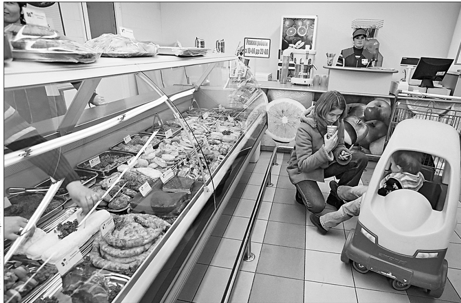
Супермаркети незабаром замінять столичні ринки

В основу дослідження, яке проводили серед семи найвідоміших брендів, що працюють на столичному продуктовому ринку ("Фуршет", Billa, "Бімаркет", "Мегамаркет", "Сільпо", "Велика кишеня" та "Еко"), покладено так званий "індекс борщу" — перелік компонентів, з яких готують страву. Серед тринадцяти продуктів, які використовують при його готуванні, вибрали найдешевші з існуючого асортименту в цих супермаркетах для наближення показника підрахунків до об'єктивних. Зокрема, в деяких супермаркетах томатна паста коштує від 0,95 грн (кореспондент "Хрещатика" брав за основу саме найнижчу ціну на цей продукт). До переліку продуктів споживчого кошика "Хрещатика" увійшло дванадцять найменувань: картопля, капуста, цибуля, зелень (окріп, петрушка), квасоля, часник, буряк, морква, томатна паста, олія (соєва), свинячі ребра і сметана.