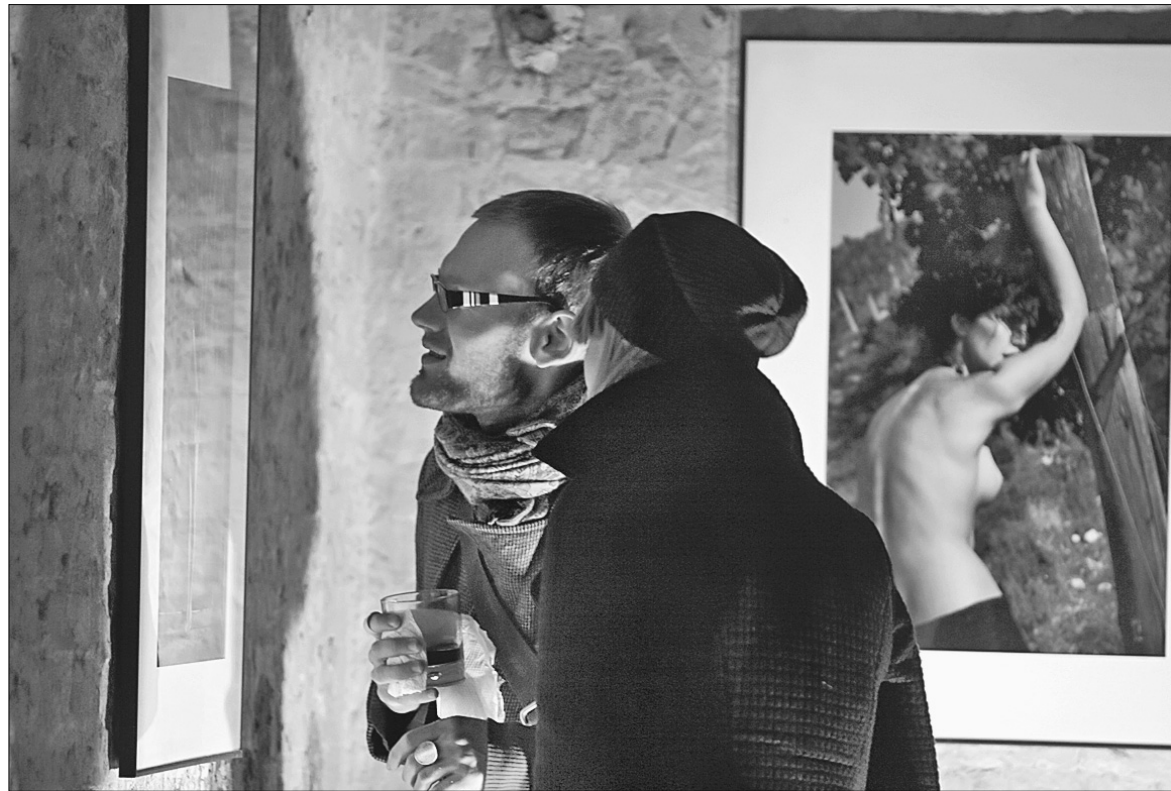
Монструозні зірки подіуму на світлинах Влада Локтева ростуть просто з дерев

Відмінність її виставленої в Києві серії “Забуваючи про моду” від традиційної fashion-фотографії в тому, що це не портрети людей у одязі, а портрети самих речей. Замість осіб — крупні плани помпезно-розкішних кринолінів, кор-