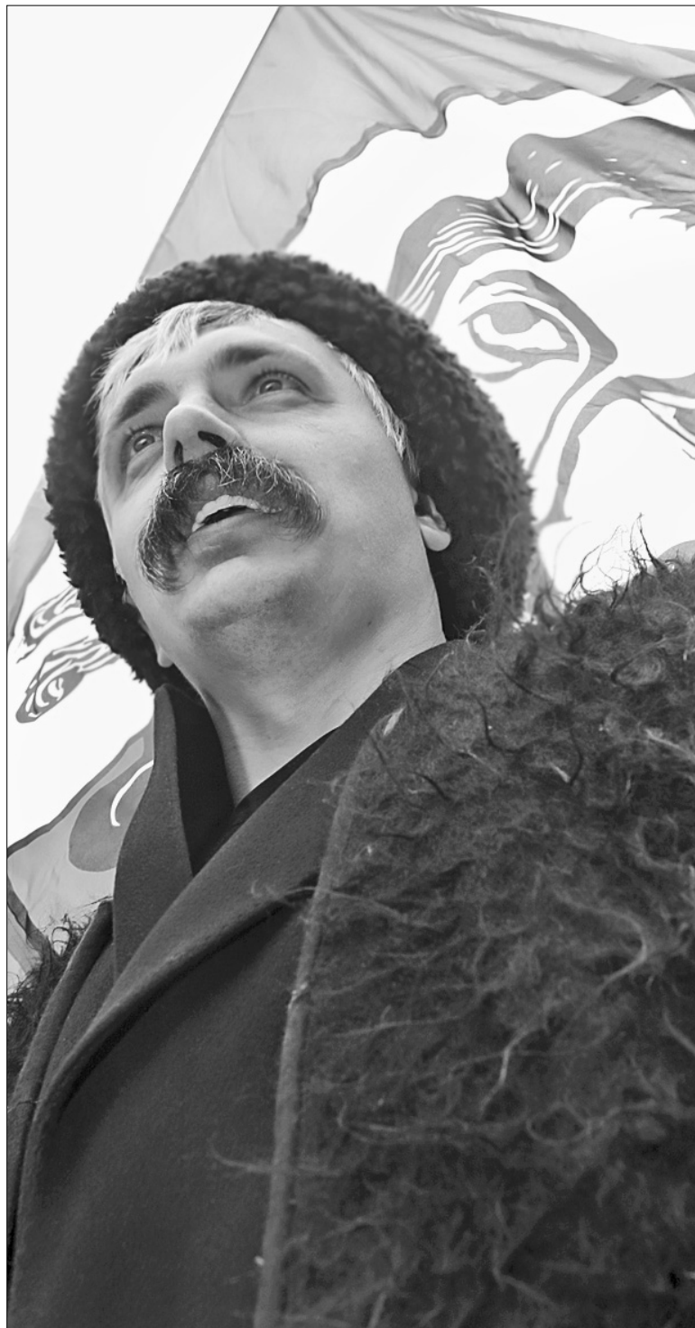
Лідер партії "Братство" Дмитро Корчинський пройнявся величчю Нестора Махна

Хоча, як з'ясувалося, Нестор Махно вже входить у сотню "Великих українців". Яке саме місце він посідає — залежить від думки сучасників. Наразі лідерами опитувань є історичні особи: Тарас Шевченко, Леся Українка, Михайло Грушевський та Григорій Сковорода ●