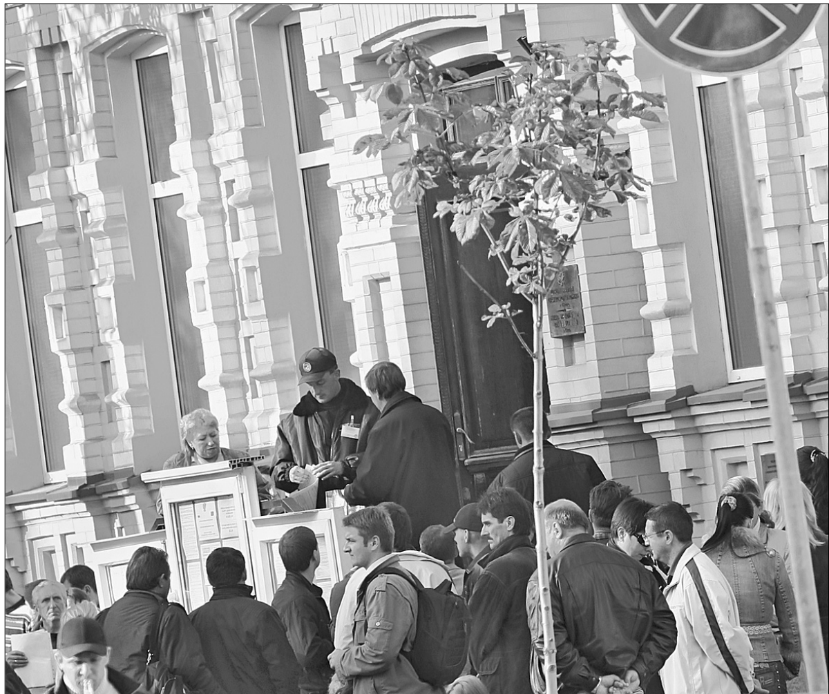
Спрощення отримання шенгенської візи зменшить черги перед посольствами європейських країн

Європарламент підтримав спрощення візового режиму з Україною