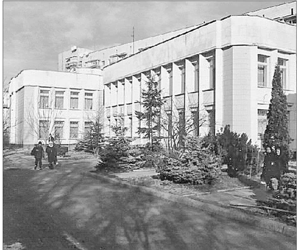
Лише 3% з діючих 44-х приватних шкіл можуть сплачувати непосильну для них орендну плату

Як зазначають представники Асоціації приватних шкіл столиці, наразі ці заклади мають сплачувати непосильну для них орендну плату. Лише 3% з діючих 44-х приватних шкіл Києва можуть це робити. З 1 вересня відрахування деяких закладів становлять 30 тис грн за місяць проти 3