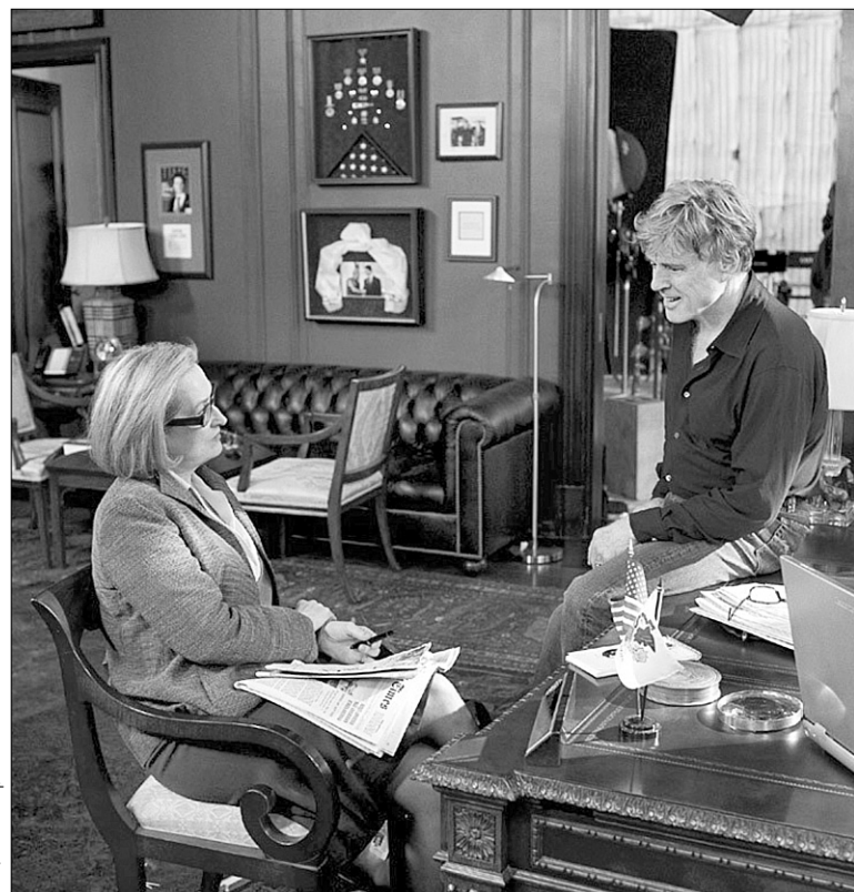
Керівництво скептично поставилося до журналістського розслідування своєї підлеглої (Меріл Стріп)

Незважаючи на акторський досвід Роберта Редфорда, “Леви для ягнят” вийшли на диво незграбними саме в плані роботи з акторами. На початку фільму досвідчена журналістка у виконанні Меріл Стріп приходить розколювати сенатора (Том Круз) на ексклюзив: власне, тут повинна розгорітися психологічна дуель між людьми, які прагнуть маніпулювати одне одним, а бачимо якусь протокольну прес-конференцію на дві персони. Коли режисер хоче показати, що сутичка досягла кульмінації, він змушує Тома Круза встати і нависнути над Меріл Стріп, яка сидить у кріслі: “Ви хочете виграти війну? Так чи ні?” — а потім наочно показати їй на карті “вісь зла”, що проходить з Іраку через Іран до Афганістану. Сенатор