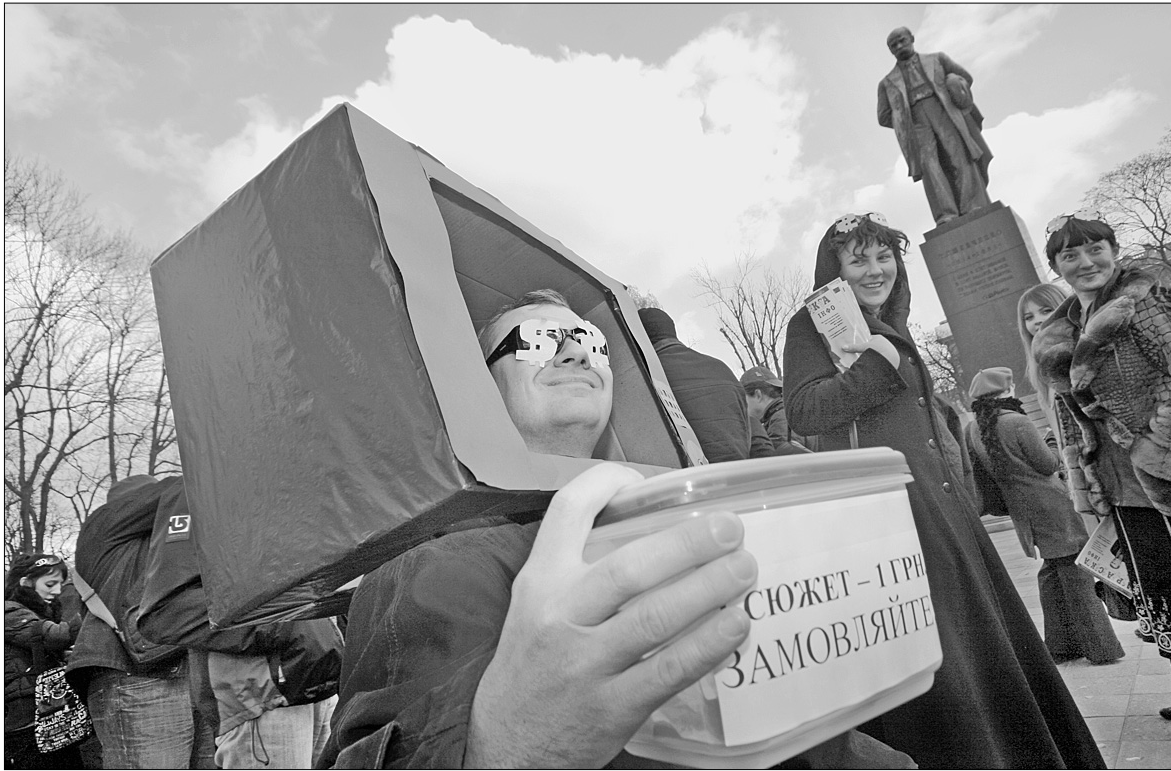
Продажні журналісти пропонують розмістити за 1 гривню замовний сюжет будь-кому з охочих

У столиці відбулася акція проти замовних матеріалів