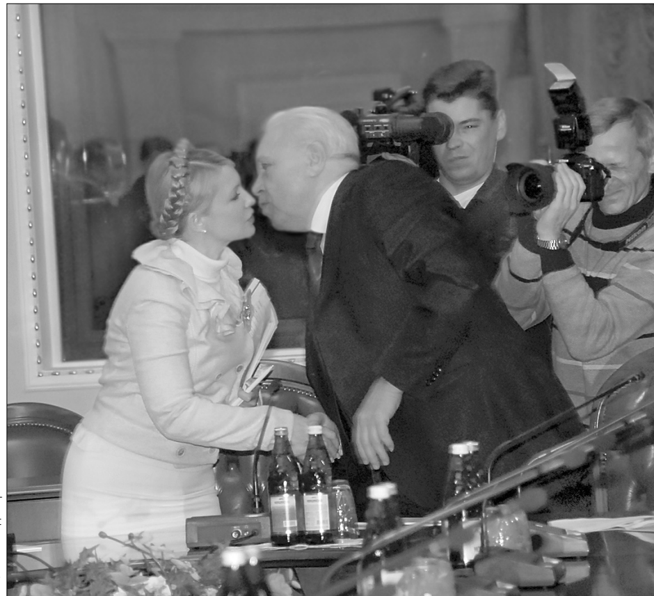
На камері поцілунки виглядають чудово, а в кулуарах йде запекла боротьба

Перед початком засідання нічого не обіцяло сумного фіналу. Окрім представників БЮТ і НУ-НС, до Верховної Ради на запрошення Олександра Мороза прийшли представники від КПУ, Блоку Литвина та навіть регіонал Раїса Богатирьова. Проте ідилія тривала недовго. Раїса Богатирьова та комуністи вирішили спочатку зареєструватися у ЦВК і лише після цього брати участь у робочій групі. Після того, як вони залишили засідання, його легітимність зависла в повітрі. Проте несподіваним рятівником помаранчевих став представник Блоку Литвина Ігор Шаров. Що й визнав "Хрещатику" нашоукраїнець Роман Зварич, заявивши, що "пан Шаров сумлінно намагався виконати свій обов'язок". Проте коли Юлія Тимошенко відкинула пропозиції Блоку Литвина щодо кадрових питань у робочій групі, пішов і він. За відсутності кворуму жодного принципового питання ухвалити не вдалося, зокрема обрати керівництво робочої групи. Незважаючи на провал, Юлія Тимо-