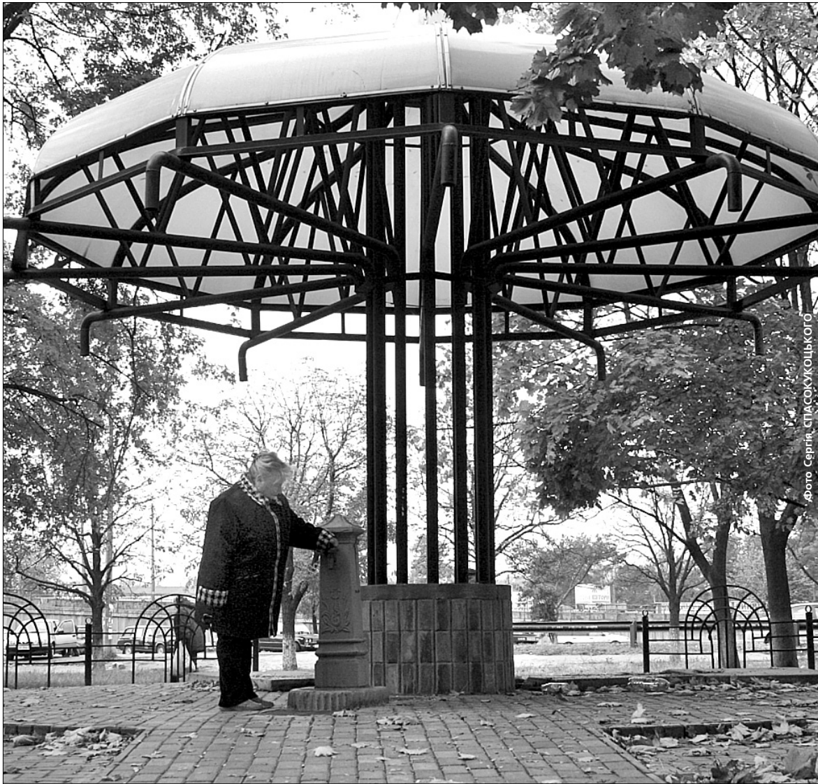
У деяких районах мешканці потрапляють у ситуацію, коли в крані бювета немає води

Чому не працюють джерела артезіанської води