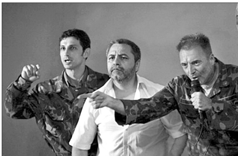
“Каліфорнійська мрія” вполювати “Оленя” на “Молодості” не здійснилася

герої іншої стрічки-призера — “Каліфорнійської мрії” румунця Крістіана Неметку (цій картині журі віддало спеціальну відзнаку). Спецпоїзд з американськими військовими зупиняє занадто прискіпливий залізничник на провінційній станції в Румунії. Через цю прискіпливість бравим воякам на чолі з полковником доводиться на кілька днів стати членами громади містечка, тобто закохуватися, сваритися й пити разом з місцевими горілку. Класична комедія ситуації перетворюється на драму, де екзамени на соціальну зрілість складають і не надто виховані румуни (невідомо, до слова, чи дістало б сміливості в когось з наших режисерів так показати українців), і американці, звісно, впевнені від самого початку, що всі іспити вони як представники своєї країни давним-давно склали. На превеликий жаль, автор стрічки загинув у автокатастрофі, не завершивши фільму, тож доводило картину до фіналу вже його друзі.