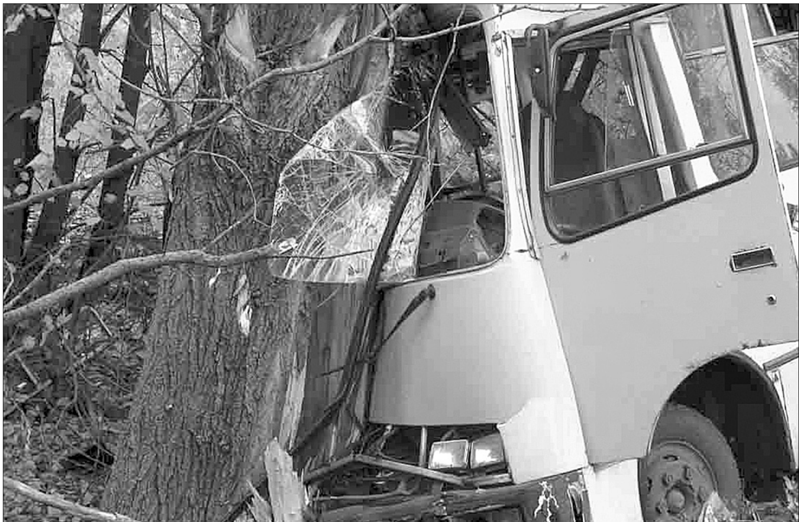
"КамАЗ" зіштовхнувся з дороги "Богдан", після чого мікроавтобус перекинувся і врізався в дерево

За офіційними даними, того дня близько чотирнадцятої години водій "КАМАЗу" під час