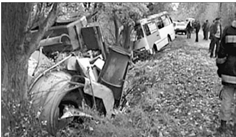
Співробітники МНС, що прибули на місце аварії, побачили на узбіччі дві машини, що перевернулися