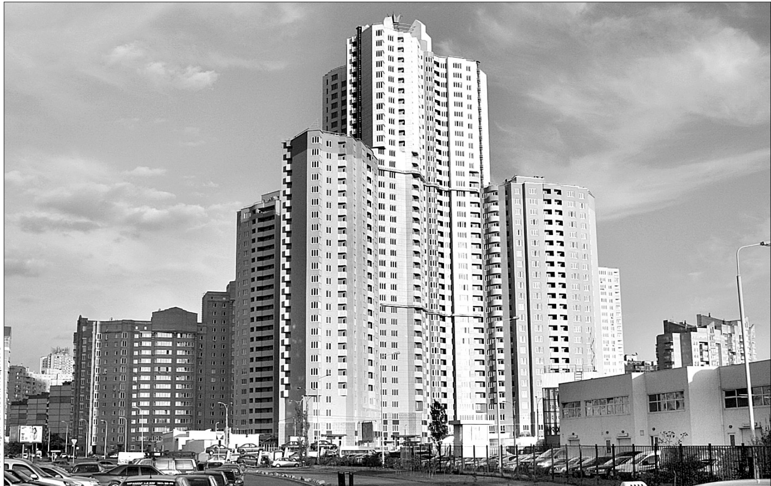
Державна архітектурно-будівельна інспекція стежитиме, аби будівельники зводили те, про що домовилися з міською владою

ДАБІ ж стане єдиним органом, що видаватиме дозволи на виконання робіт, накладатиме штрафні санкції, зупинятиме будівництво, але, крім нього, у прийнятті об'єктів у експлуатацію братимуть участь й інші організації. Таким чином, Міністерство перебирає на себе усі важелі контролю, а посередником виступатиме ДАБІ. Ця структура діятиме у складі Міністерства ре-