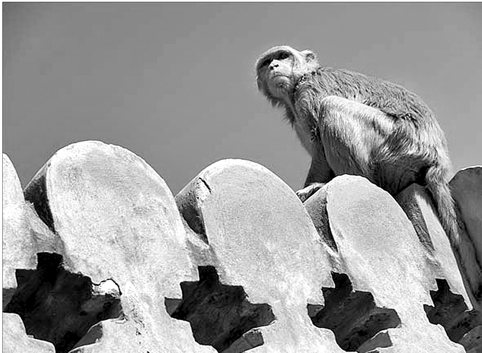
Дикі макаки не зупинились на нападі на віце-мера Делі і шукають нових жертв

віддати Риму. Метр доволі дошкульно висловився на адресу “старих” фестивалів, які стали надто естетичними, й енергійно вітав повернення Риму до пересічного глядача.