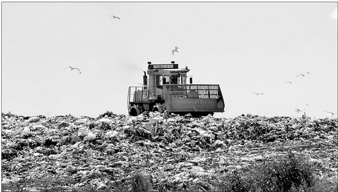
На полігон № 5 вивозять приблизно 600 тис. тонн відходів на рік