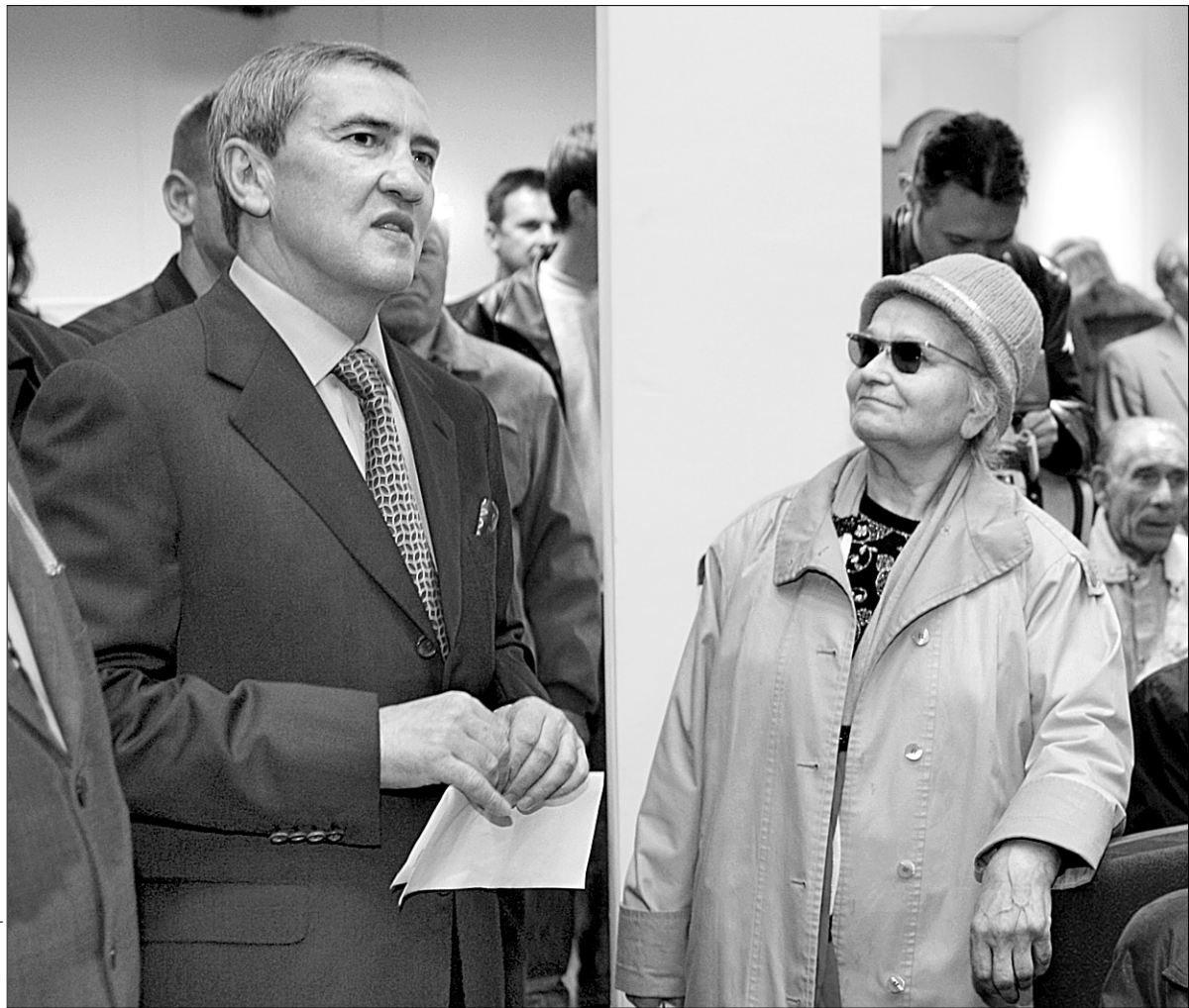
В актовому залі Палацу ветеранам вдалося тісно поспілкуватися з Леонідом Черновецьким

У Києві відкрили новий палац для ветеранів війни та праці