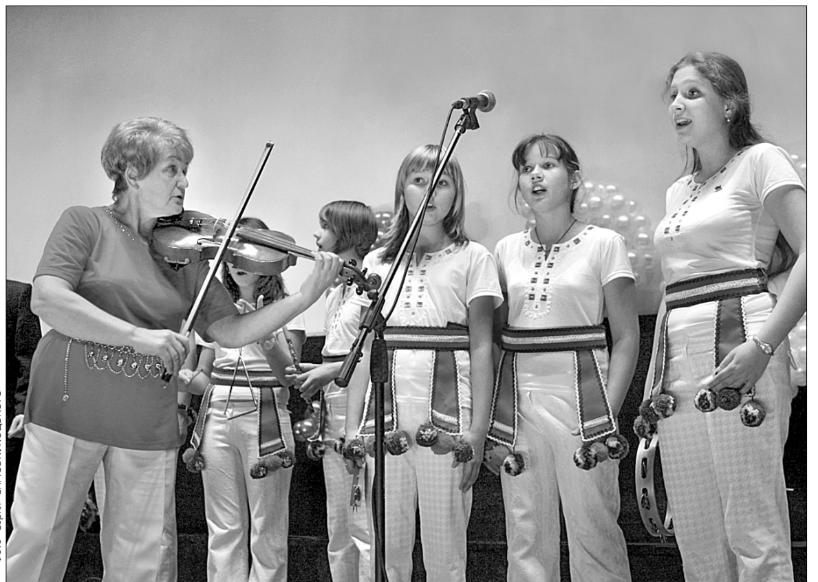
Київський вокальний ансамбль "Шкільний корабель" з натхненням взяв участь у фестивалі

Яскравим був виступ колективу з Дніпропетровська "Майстерок", який отримав спеціальний приз. "Колектив уже побував у багатьох країнах світу, — розповів