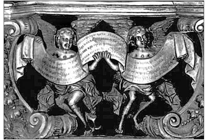
Орнамент срібних царських врат відтворюють за технологією XVIII століття

на яких зображено відтворення срібних царських врат. На частині експозиції — пошкоджені плитки, що збереглися, а далі увесь технологічний процес — очищення, вирівнювання, доповнення знищених фрагментів. Реконструкцію розпочали торік у жовтні. В Україні й Росії фахівців не знайшлося, отож довірили цю ювелірну роботу польським майстрам. Науковці "Софії" дослідили архівні графічні малюнки та фотографії врат. За допомогою цифрових технологій фото збільшили в масштабі 1:1. Майстри працюють із використанням лише тогочасних технологій (зокрема техніки тиснення срібної бляхи) та оригінальних знарядь (чеканів). Срібло найвищої про-