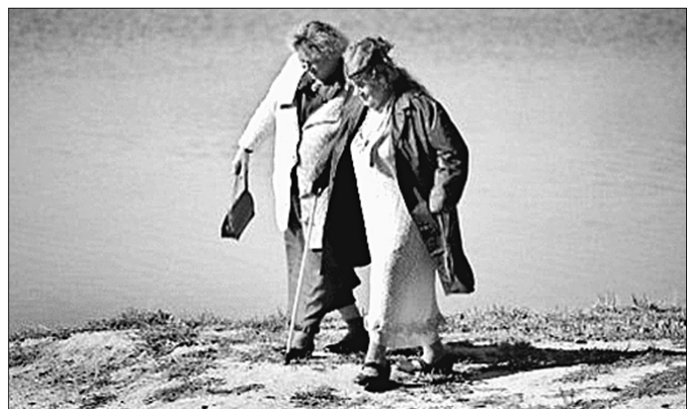
Фільм “Біла річка” Єви Нейман тест на “Молодість” пройшов

Щоправда, головне завдання фестивалю на цьогогорічній “Молодості” так і не виконали. Мова про геніїв, яких чомусь знову не відкрили. Президент фестивалю Андрій Халпахчі знає чому: на церемонії закриття він вибачився за увесь світовий кінематограф, котрий, мовляв, тримає нині паузу після потужних вибухів початку 60-х, а потім 80-х років. Залишається сподіватися, що про новий вибух, якщо він таки станеться, першими дізнаються саме глядачі “Молодості” ●