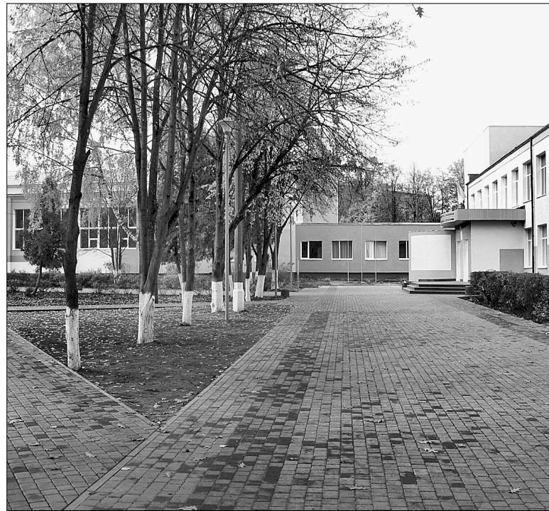
Так школа виглядає після реконструкції

Така вдала практика поєднання інтересів простих мешканців та бізнесу продовжуватиметься і надалі, — впевнені у компанії "Київбудсервіс", яка зосереджу-