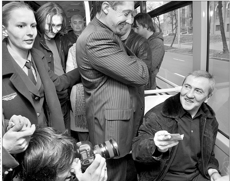
Як і всі пасажирів, Леонід Черновецький розраховувався за проїзд у тролейбусі

Також київавтодорівці поскаржилися Леонідові Черновецькому на брак проектно-кошторисної документації з реконструкції і будівництва дорожніх об'єктів. Георгій Глінський нагадав, що за 9 місяців 2007-го його фахівці на будівельні й ремонтні роботи витратили понад 900 млн грн. На наступний рік передбачено вже понад 1,6 млрд грн. А для виконання запланованих Програмою будівництва та реконструкції дорожньо-транспортних об'єктів заходів потрібно понад 19 млрд грн.