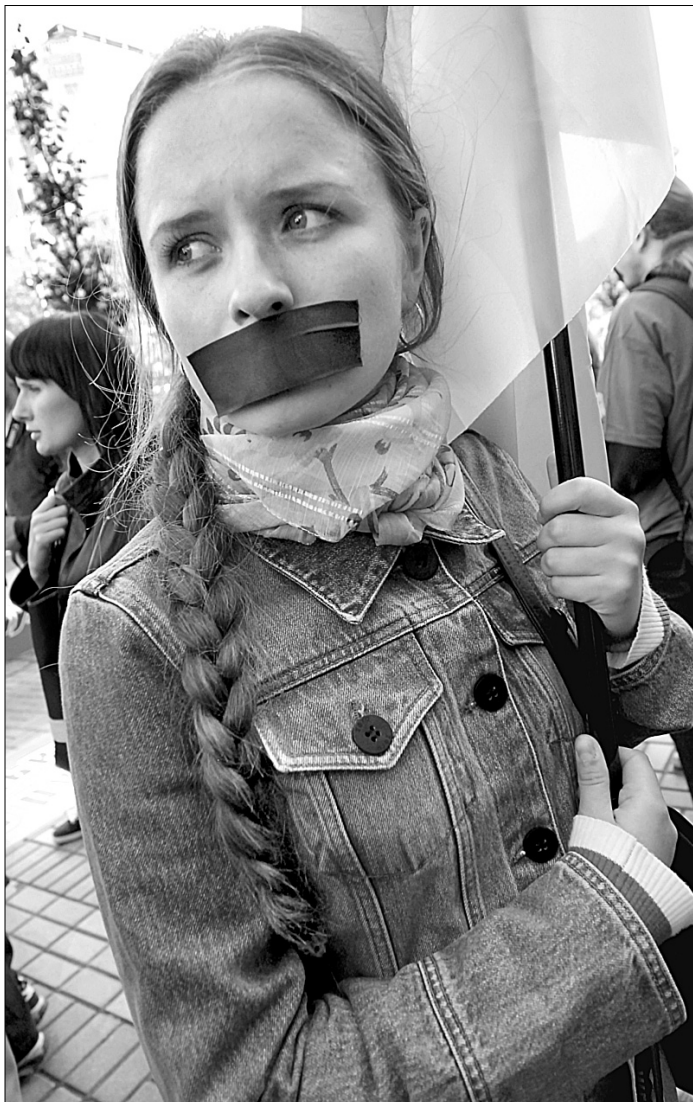
Доки політики намагаються вирішити за українців, якою мовою їм розмовляти, самі громадяни надають перевагу мовчанню

Проте, погодившись на умови Президента, Партія регіонів може втратити набагато більше. Цього року вони вже не дорухувалися чимало голосів на Сході через свою непослідовність. Прихильність виборців до донецького бізнес-клану лежить, вочевидь, не в харизматичності "лідерів", а саме в площині ідеології, яку вони вдало використовують на виборах і одразу після них забувають. Нерозуміння цього може поставити хрест на