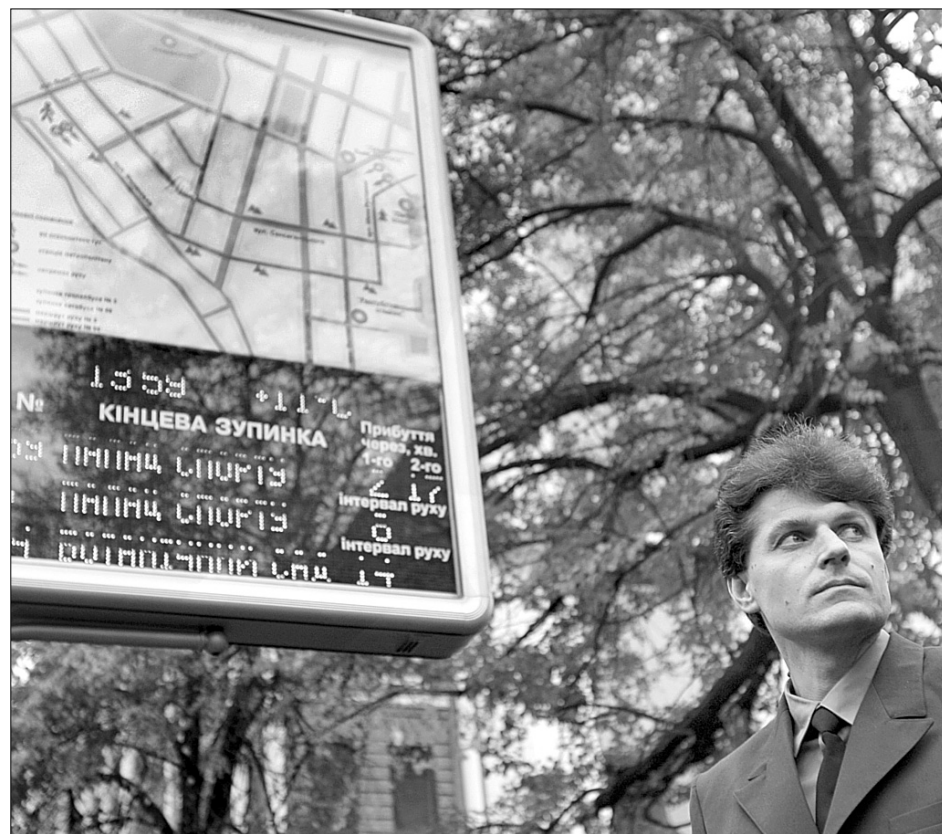
Нові електронні табло на зупинках дозволять пасажирам дізнатись час прибуття потрібного тролейбусу чи автобусу

На вулиці також передбачені місця для паркування автомобілів, а на пішохідних переходах знижено бортові камені для зручності інвалідів та літніх людей. Фахівцями висаджено дерева, збережено всі газони та зелені насадження •