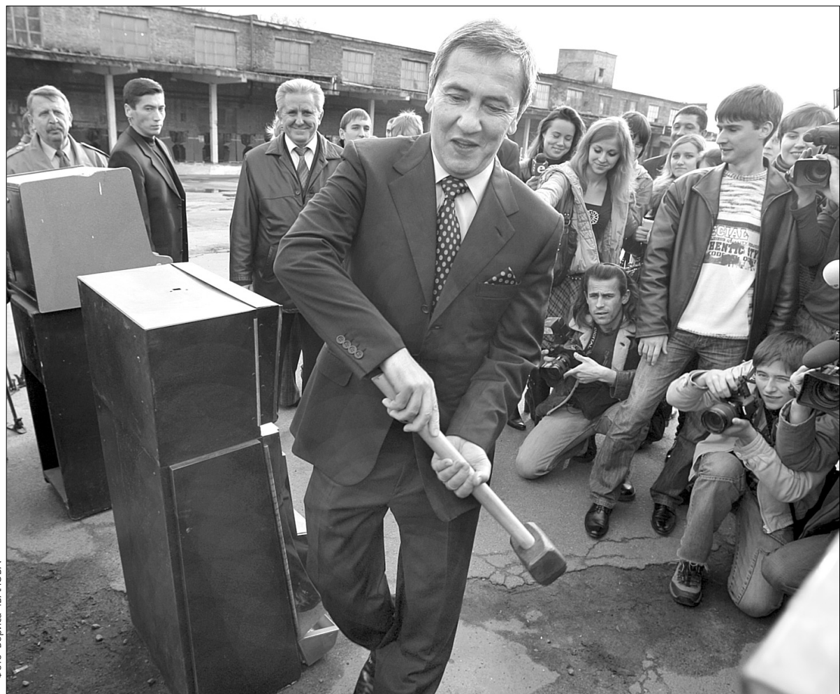
Леонід Черновецький на власному прикладі показав, як треба боротися з гральними автоматами

Мер Києва продовжує боротьбу з нелегально встановленими гральними автоматами