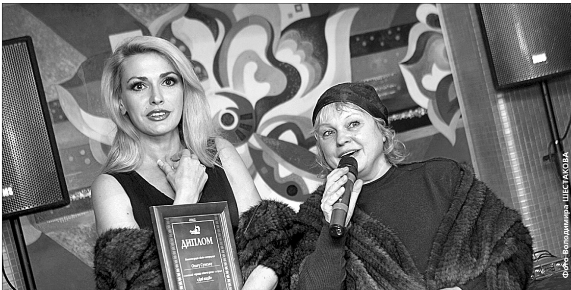
Ольга Сумська (ліворуч) одержала нагороду від Київського медіа-холдингу за найкращу жіночу роль