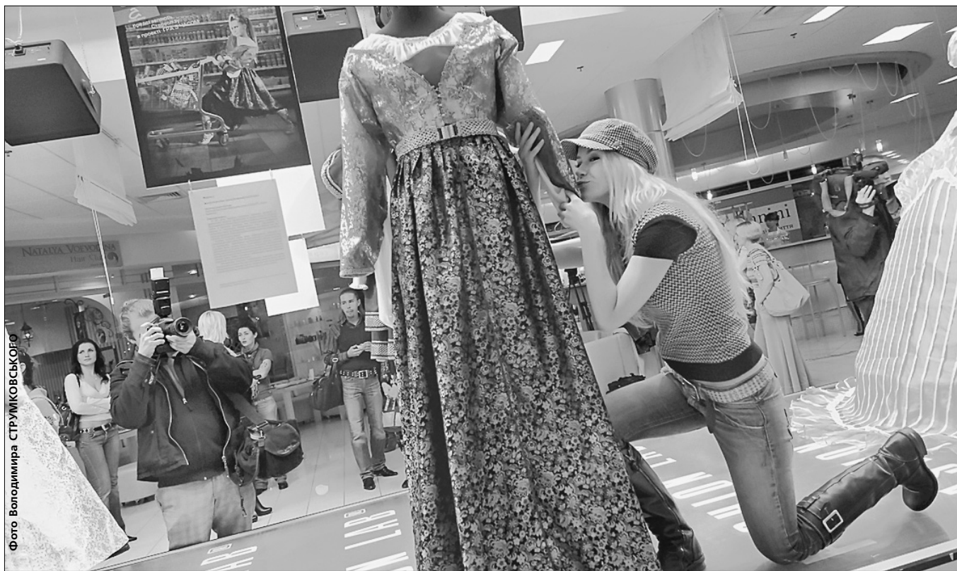
Stereoliza з пошаною ставиться до історії