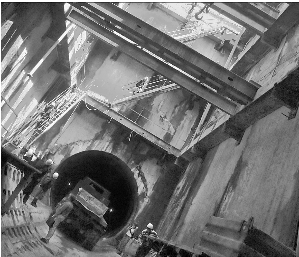
Влітку 2006 року будівельні роботи розпочали з новою силою