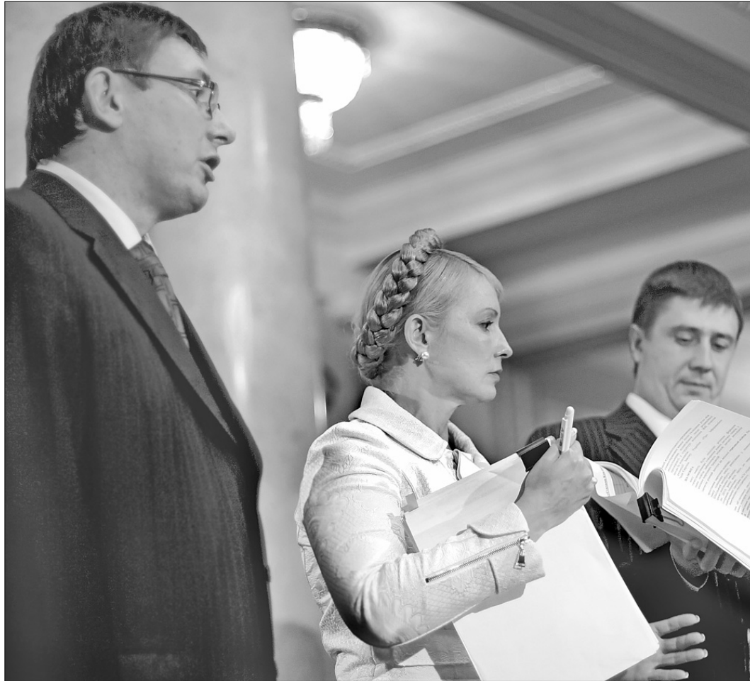
Юлія Тимошенко вважає, що угоду треба спочатку підписати, а потім — читати

Голова Центру досліджень політичних цінностей Олесь