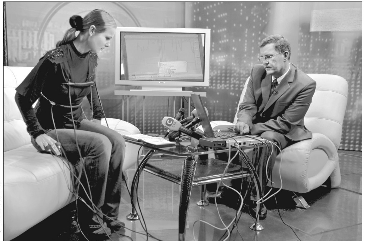
Журналістка каналу СТБ зізналася, що вживає наркотики і бере хабарі