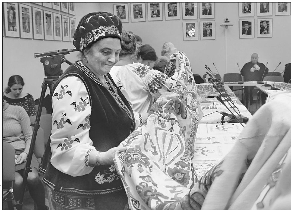
Столичні майстрині розгортають шитво, щоб зростити на полотні київську гілку “Древа життя”

Нині цей витвір народного мистецтва вже виконано на 95%, і важить він майже десять кілограмів. З Києва рушник повезуть до Львова, а звідти — в Польщу, адже там численна українська діаспора і чимало заробітчан, які хочуть долучитися до творчого процесу. До слова, в Донецьку ще три роки тому було вишито рушник області. Почин підхопили Полтава і Тернопіль.