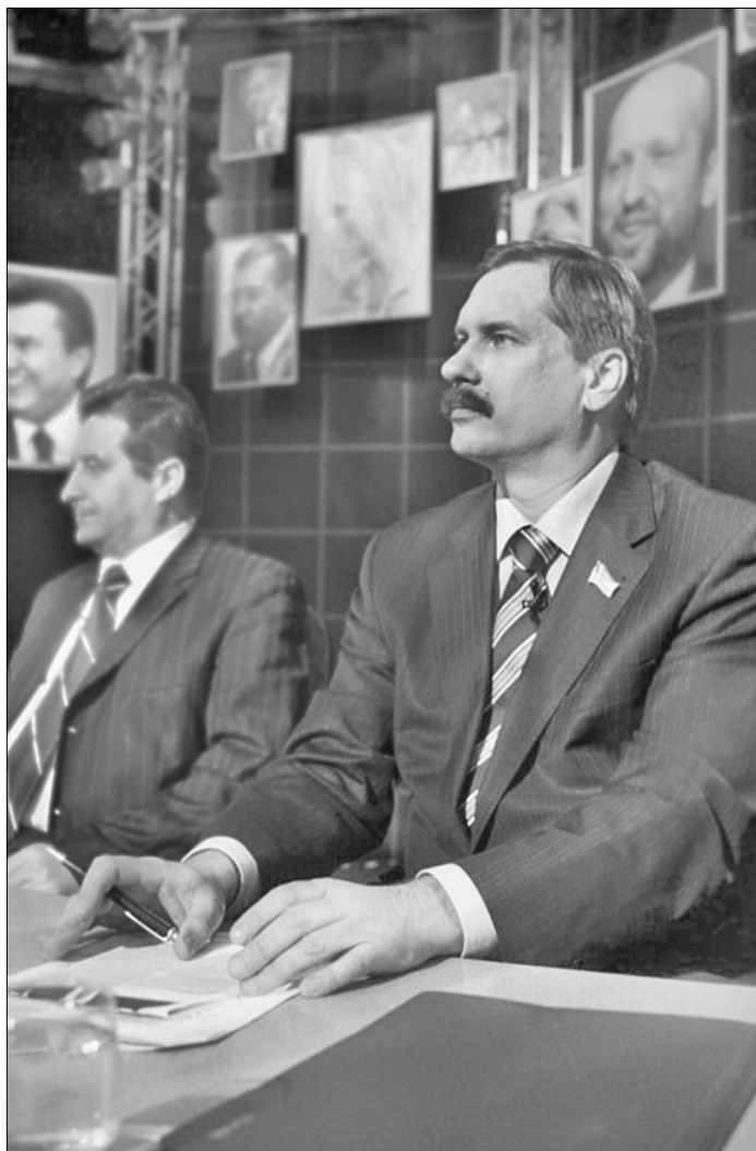
Тарас Чорновіл бачить майбутнє без Юлії Тимошенко

На користь припущення, що владна еліта досі розглядає різні варіанти, може свідчити і учорашнє призначення члена Блоку Литвина Олексія Гаркуші керівником Миколаївської ОДА. За законом про Кабінет Міністрів, саме Кабмін вносить Президенту подання на призначення керівників місцевих держадміністрацій. Тобто без взаємної згоди Віктора Януковича і Віктора Ющенка соратник Володимира Литвина не зміг би стати очільником області. Враховуючи, що саме силу Литвина