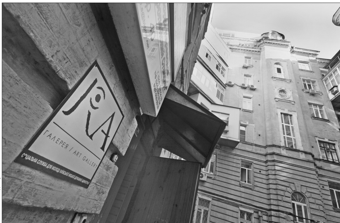
Через умови оренди, які райдержадміністрація виставила "Галереї Ра", її вивіска невдовзі може змінитися на якусь іншу