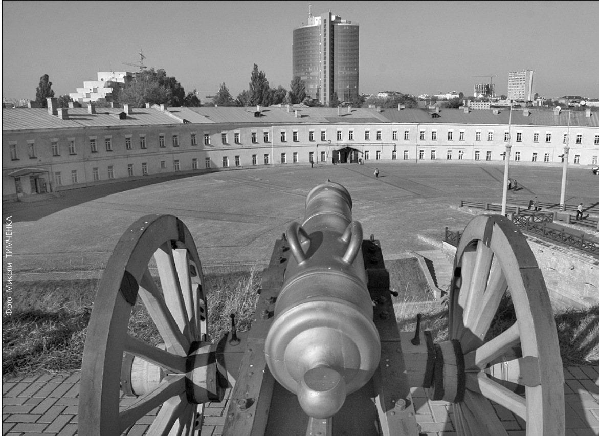
Київській фортеці є чим відповісти на територіальні претензії університету культури

Михайла Поплавського звинувачують у знищенні історичних пам'яток