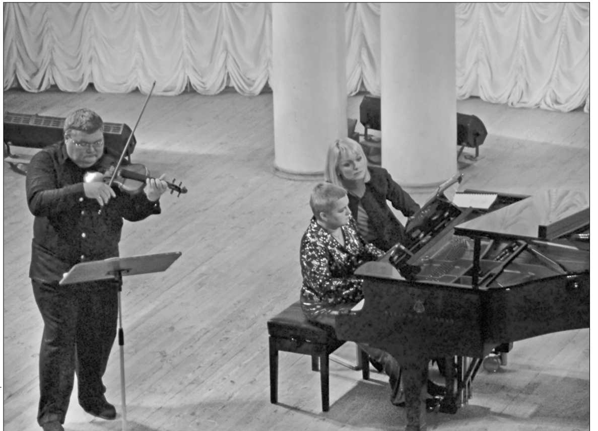
Сергій Стадлер, як завжди, підкорив киян легкістю

Коли критики рік у рік захоплено повторюють ті самі епітети, пишучи про Стадлера, вони аж ніяк не перегинають палицю. Особливо там, де йдеться про технічну досконалість музиканта. Справді, які можуть бути претензії, коли за плечима скрипаля школи Ойстраха, Когана, Третьякова, Гутникова та Ваймана. Нічого дивного, що Стадлер свого часу протягом кількох років забирив усі перші премії з Гран-прі та золотими медалями на додачу на конкурсах Маргарити Лонг і Жака Тібо в Парижі, "Концертино Прага", конкурсі Чайковського в Москві та ще на кількох музичних змаганнях. І коли люди, бува, з гіркою досвідом та з якимось земним відчаєм повторюють оте затерте "не прагнїть досконалості, бо її немає", хоч як би пафосно й банально це звучало, хочеться порадити їм послухати Стадлера. Його музичну віртуозність можна порівняти з віртуозністю метелика в польоті.