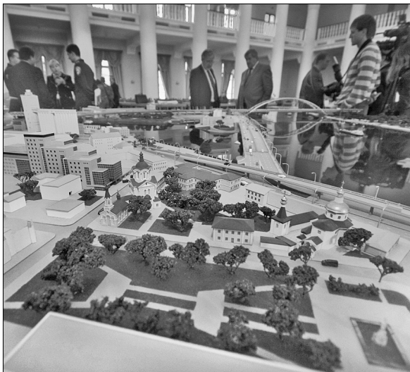
Головне управління транспорту отримає додаткові кошти на розвиток транспортної інфраструктури

Також комісія доручила Денису Басу передбачити виділення 20 млн грн на фінансування КП "Ки-