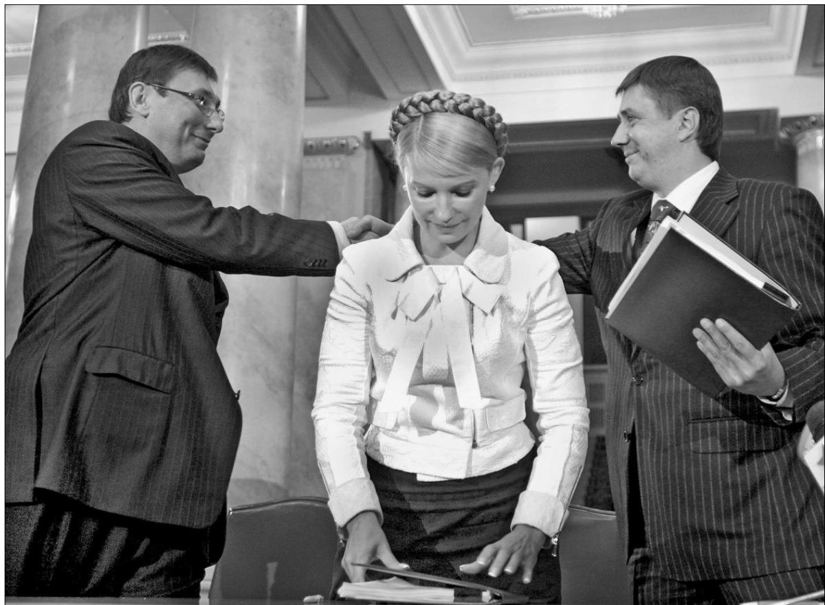
За спиною Юлії Тимошенко Юрій Луценко (ліворуч) та В'ячеслав Кириленко вже тиснуть один одному руки

Помаранчеві сили в присутності Віктора Ющенка домовились про співробітництво