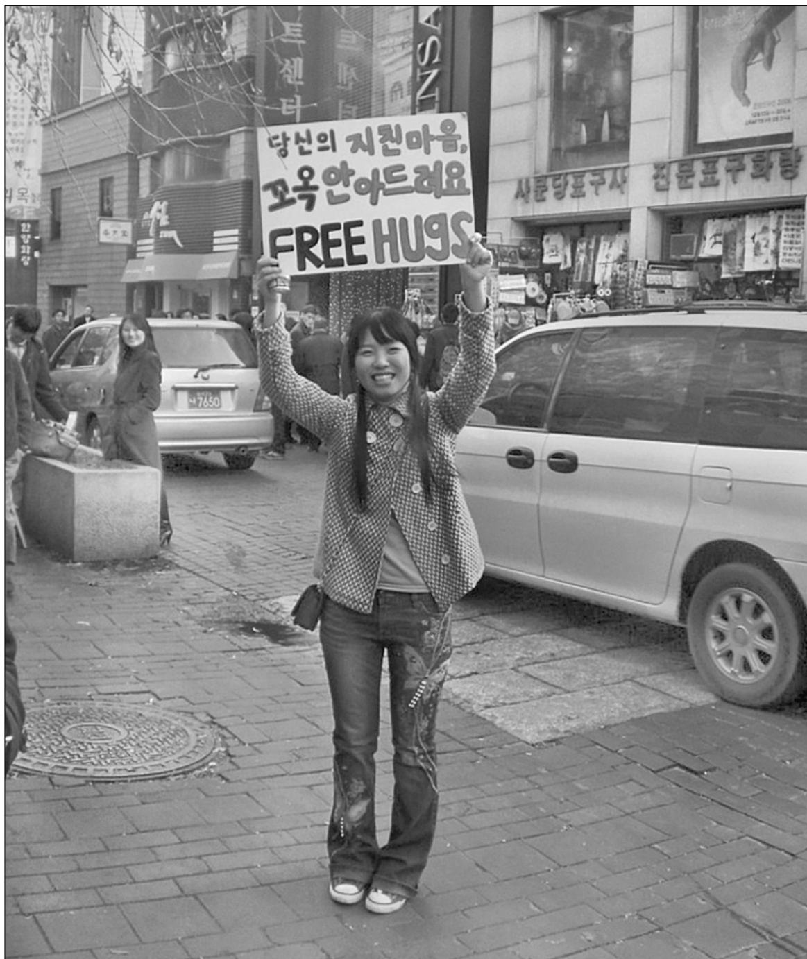
Обняти молоду гонконгівську дівчину можна зовсім безкоштовно

Рамона Райпстон, виконавчий директор Американського союзу громадських свобод, назвала ухвалені рішення важливим і "задовільним". "Ми не хочемо, щоб люди спали на вулицях. Ми б хотіли, щоб у кожного був бу-