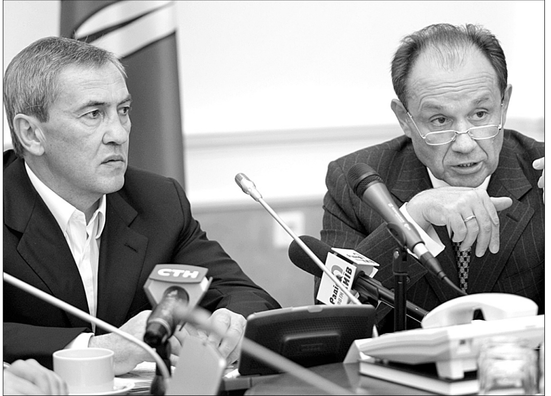
Анатолій Голубченко показав Леонідові Черновецькому голів районів, які не зуміли скористатися виділеними їм коштами

Також Анатолій Голубченко звернув увагу на те, що міська влада забезпечить оплату поточних платежів "Київенерго" і на цей час жодної заборгованості перед компанією у міста немає.