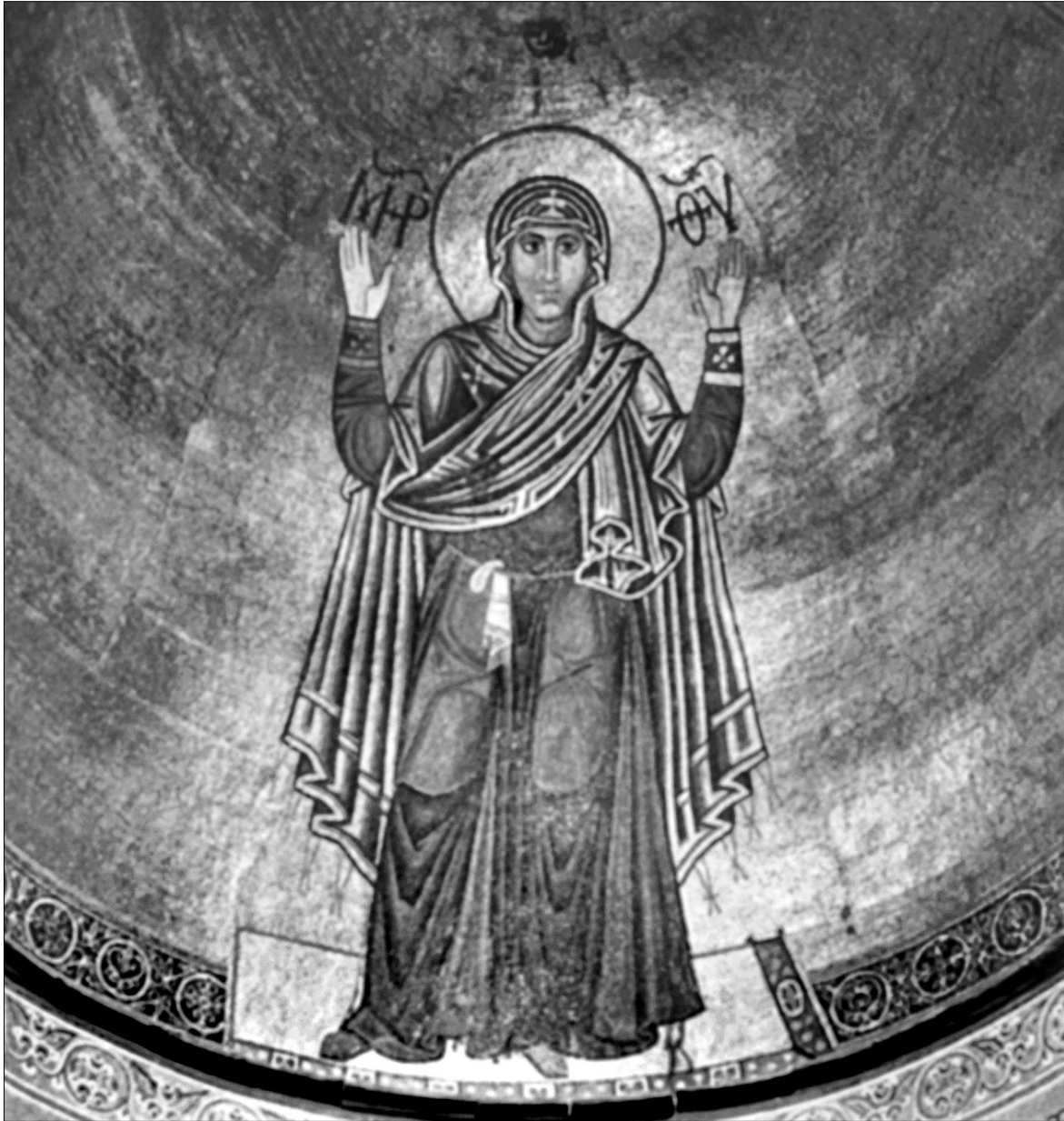
Реставрація Оранти допоможе їй не зруйнуватися від шкідливих зовнішніх впливів протягом двадцяти років

Завершилися роботи з реставрації мозаїки в Софійському соборі