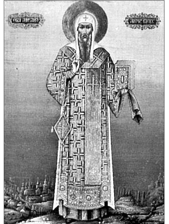
Святитель Михаїл, перший митрополит Київський

7 жовтня Неділя 19-та після П’ятидесятниці. Преподобного Феодосія Манявського (1629). Первомучениці рівноапостольної Фекли (І). Преподобного Никандра, пустинножителя, Псковського чудотворця (1581). Святого Владислава, царя Сербського. Мирозкої ікони Божої Матері (1198).