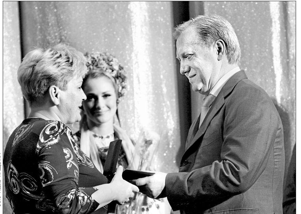
Від імені мера педагогів привітав Віталій Журавський

Урочистий вечір з концертом до Дня учителя влаштували в Київському академічному театрі оперети. Від столичної влади освітян вітали заступник голови столичної міськдержадміністрації Віталій Журавський та начальник Головного управління освіти і науки КМДА Лілія Гриневич. 48 найкращим педагогам столиці вручили відзнаки Головного управління освіти і науки — нагрудні знаки "Відмінник столичної освіти". Нагороджені директори, викладачі навчальних закладів та працівники районних управлінь освіти до значка отримали й вагоміше заохочення — до свята їм виплатили по два оклади. Крім того, всі без винятку педагоги до Дня працівника освіти отримали премію в розмірі посадового окладу — з міського бюджету додатково виділено 70,9 млн грн.