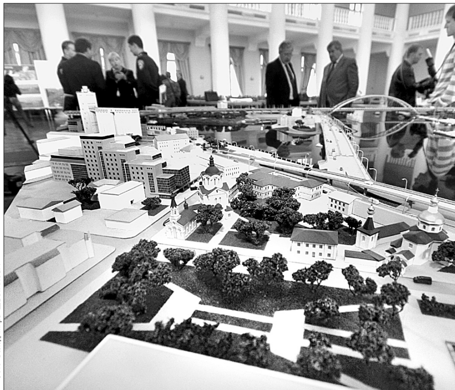
Через чотири роки транспортна інфраструктура міста розів'ється шістьма автотерміналами