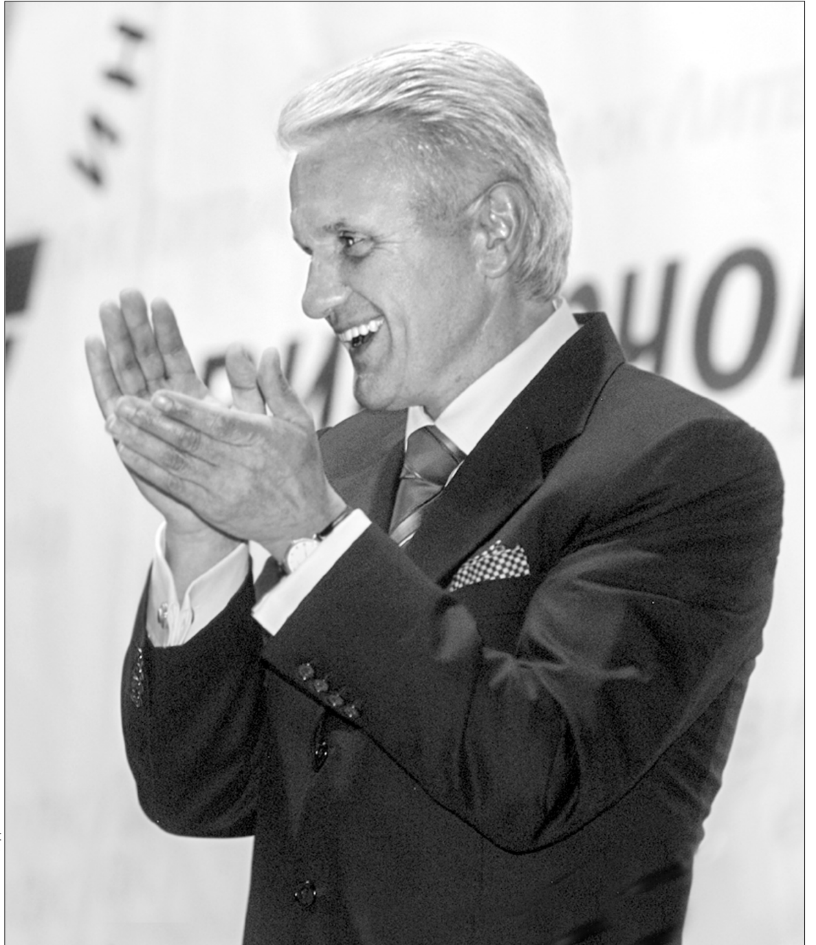
Володимир Литвин в захваті від себе

Цікаво, але сам Володимир Литвин зробив кар'єру не завдяки ідеям, боротьбі за демократичне відродження або служінню на благо вітчизні десь у регіонах. Суть його стратегії викладено в одному з телевізійних роликів під час кампанії-2006. Там один із героїв сказав: "А я б з ним випив!" Саме коло владного столу і формувався Володимир Литвин.