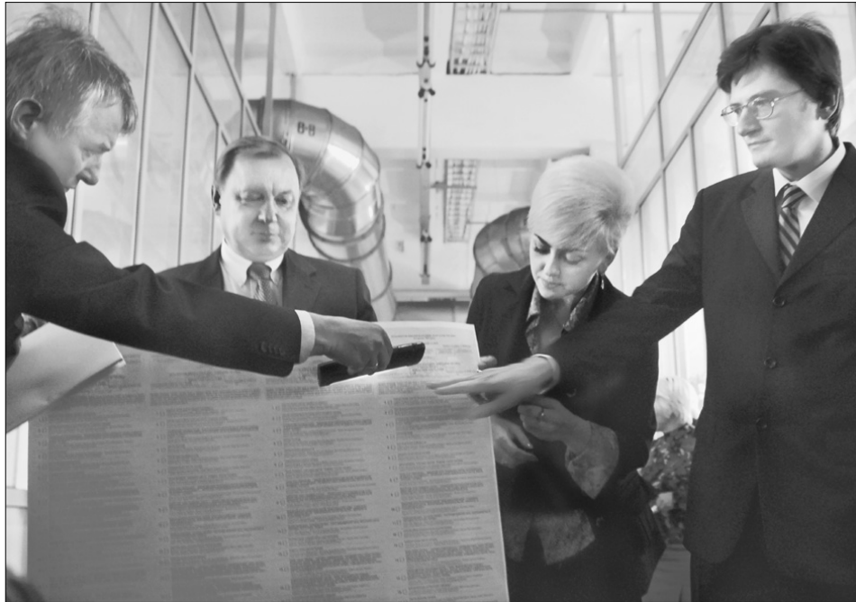
Працівники Центрвиборчкому перевіряють ступінь захисту бюлетенів

Так було не завжди. До 1999 року бюлетені для голосування друкували на звичайному білому папері звичайною чорною фарбою. Скільки тоді було надруковано "лівих" бланків — ніхто не знає, адже вони тоді не вважалися цінними паперами, як нині.