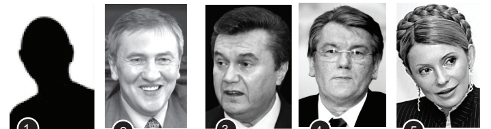
Свій варіант 24 % Черновецький Л. 21 % Янукович В. 11 % Ющенко В. 10 % Тимошенко Ю. 8 %

Згідно з результатами опитування, здійсненого call-центром Київської міської державної адміністрації, окрім своїх варіантів відповідей, що в сумі становлять 24 %, найбільше з опитаних киян із задоволенням вирушили б до Парижа з Леонідом Черновецьким (21 %), Віктором Януковичем (11 %) та Віктором Ющенком (10 %). Кияни, мабуть, серйозно підійшли до відбору політиків на цю роль, бо з мером можна було б порівняти обидва міста.