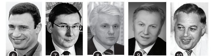
Кличко В. 7 % Луценко Ю. 6 % Литвин В. 5 % Журавський В. 5 % Симоненко П. 4 %