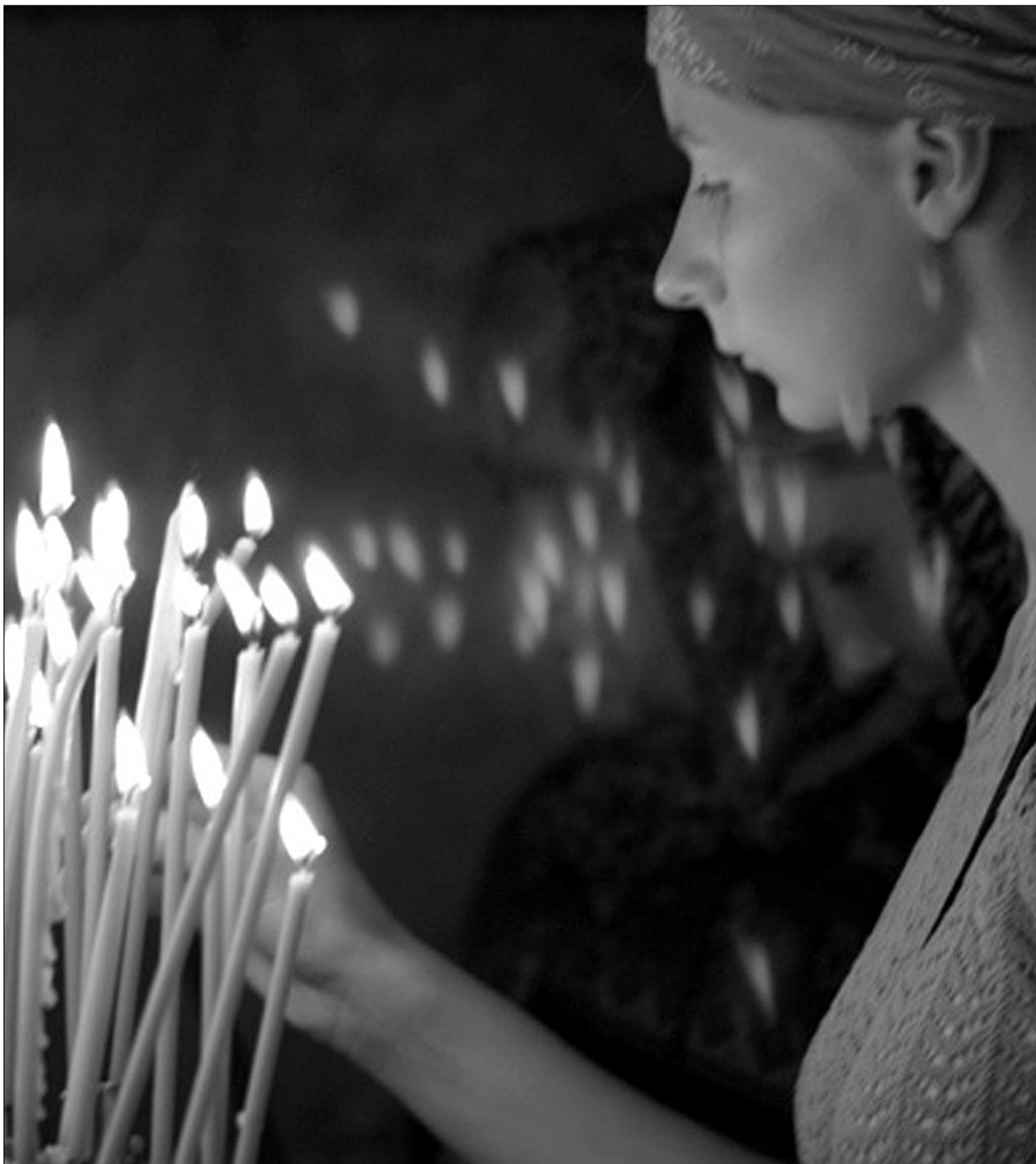
Малозабезпечені кияни чекають допомоги не тільки від мера, а й від церков

Мер Києва зустрівся з представниками релігійних організацій