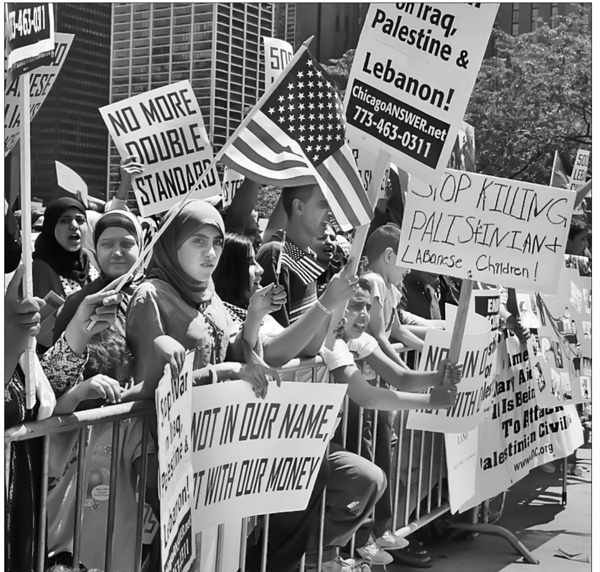
Своє невдоволення зовнішньою політикою США мусульмани воліють висловлювати в безпечній Європі

Лікарі звертають увагу на те, що такі правила вже діють у Норвегії та Сполучених Штатах Америки, і мають за мету зберегти здоров'я дитини, а не обмежити права та свободи жінок.