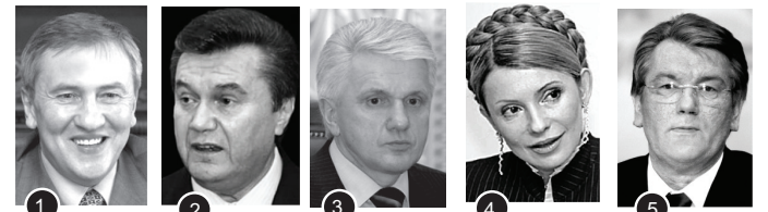
1 Черновецький Л. 37 % 2 Янукович В. 11 % 3 Литвин В. 11 % 4 Тимошенко Ю. 10 % 5 Ющенко В. 8 %

За результатами опитування, проведеного call-центром КМДА, більшість киян переконані, що саме мер Києва Леонід Черновецький заслуговує на золоту рибку (37%). Непоганими "рибалками" мешканці нашого міста вважають Віктора Януковича та Володимира Литвина (обидва по 11%), хоча, судячи з рейтингів, у них бажань має бути втричі менше.