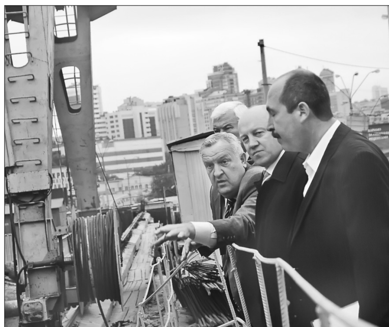
Учасники виїзної наради виявилися, як ніколи, близькими до об’єктів, що оглядали

Неподалік Амурської площі до кінця року завершать спорудження тролейбусного депо. Крім того, від площі відведуть нову тролейбусну лінію, що забезпечить під’їзд мешканців Теремків до метро. Лінія протяж-