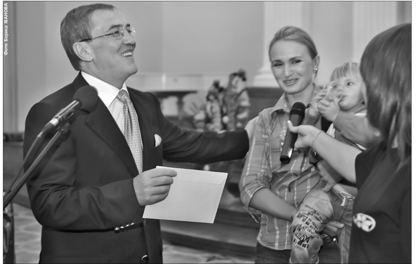
Леонід Черновецький здійснив багаторічну мрію 61 київської родини

Мер вручив черговикам документи на нові квартири