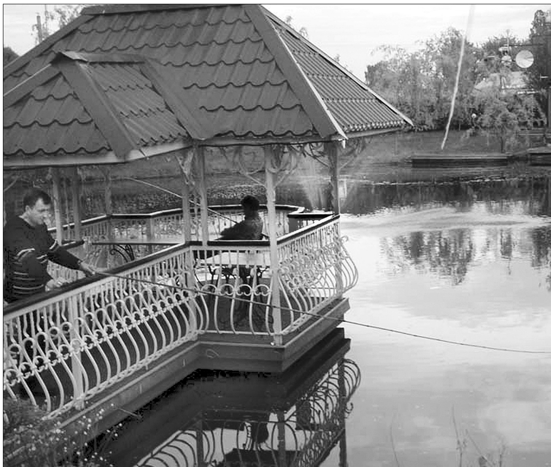
Заміський відпочинок — найкраща альтернатива метушливому мегаполісу

З подорожі привезли багато сувенірів, статуєтку богині-захисниці Кумерії, яка стоїть у нас в офісі, фігурки будд, яків. Символ Тибету — як. Три золотих яки стоять у місті Хаса ●