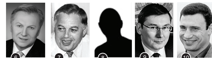
6 Журавський В. 8 % 7 Симоненко П. 6 % 8 Свій варіант 5 % 9 Луценко Ю. 3 % 10 Кличко В. 2 %