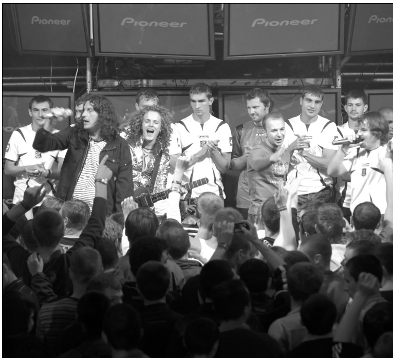
Гравці ФК "Арсенал" насолоджувались концертом просто на сцені

У неділю в столичному Палаці спорту відбулося перше "Arsenal Show", влаштоване на честь відродження футбольного клубу "Арсенал-Київ". Вадим Рабінович, який віднедавна став президентом і власником муніципального ФК, розповів, що прагне повернути футболу видовищність, а глядачам — кумира. Щоправда, вечірка, влаштована клубом, поки що зібрала більше глядачів, аніж матчів за участю команди.