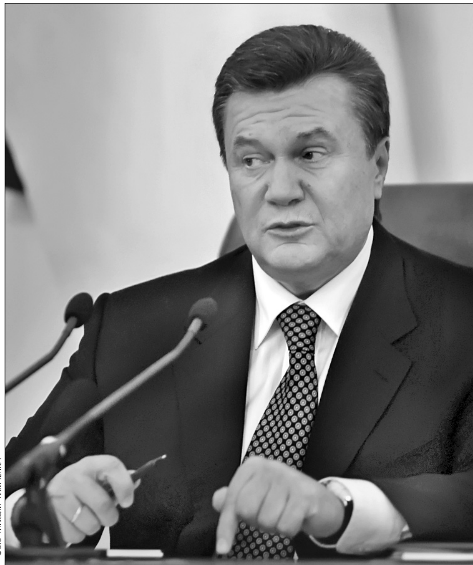
Віктор Янукович: "Інвесторів до мене. Сюди!"

Зустріч із Юлією Тимошенко розпочалася о 8.30. Мабуть, саме це спричинило не дуже бадьорий настрій в залі — бізнесмени теж люди і їм хотілося спати. Більшість присутніх представників великих компаній під час презентації часом поглядали на годинник, щоб не запізнитися на зустріч з іншим фаворитом передвиборних перегонів — Віктором Януковичем. У запевненні Юлії Тимошенко про стрімке покращення життя великих компаній після виборів вони, вочевидь, не дуже повірили, вирішивши "покращувати життя вже сьогодні" — на зустрічі з чинним прем'єром. Тим більше, що Віктор Янукович висловив впевненість, що наступний уряд буде коаліційним, і що він сподівається очолювати Кабмін не менше 5 років. "Потрібно, щоб кожний уряд у нашій країні працював не менше п'яти років — тоді матимемо по-