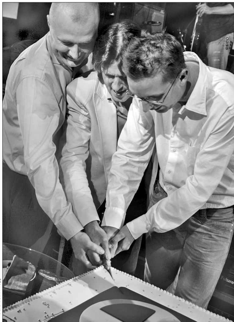
Народження каналу SMASH!TV відзначили по-людськи — тортом

Одним із віджеїв та обличчям каналу стане екстравагантна українська співачка та письменниця Ірена Карпа, що знайомитиме глядачів з свіжими новинами світу музики та шоу-бізнесу. Решту ж ведучих знайшли за допомогою кастингу, оголошення про яких розміщували на сайті каналу. Поки що «світлтимуться» на каналі ли-