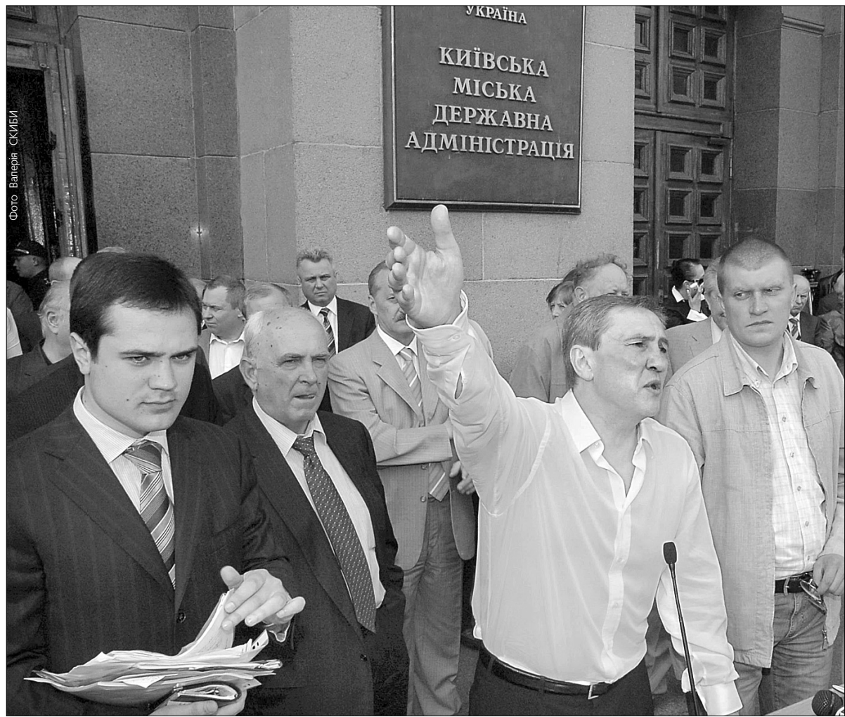
Мер Києва запропонував депутатам займатися агітацією і чорним піаром де завгодно — хоч на вулиці

Леонід Черновецький не хоче, щоб столичний парламент став місцем передвиборних чвар