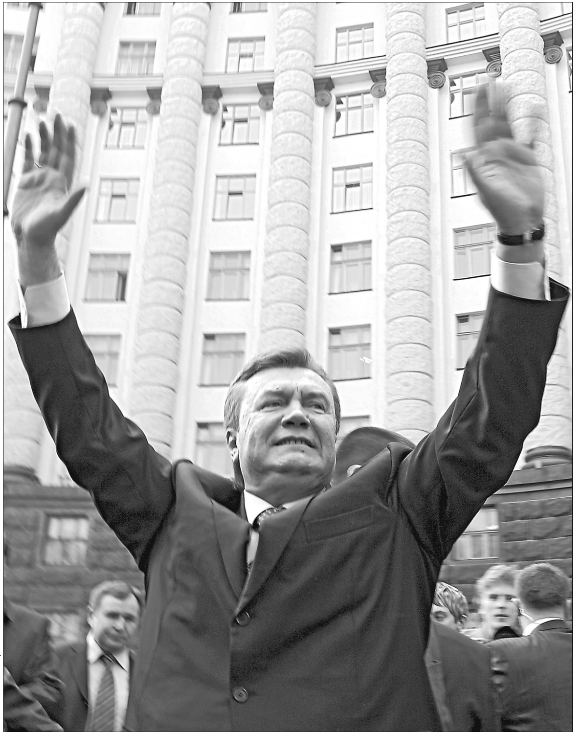
Віктор Янукович показує, який в нього рейтинг

Але чому саме Янукович став лідером Сходу? Які процеси стояли за механізмом підняття його на прапор незадоволених ідеологією держави? Першим великим політиком, якого підняло російськомовне українське суспільство, був Леонід Кучма. Другий президент був значно ближчим до реальної економіки, ніж перший. Це головна риса, яка має бути у лідера Сходу. Адже коріння процесу асиміляції лежить у економіці. Якщо економічне поле залишиться за російськомовною частиною суспільства, ні про яку асиміляцію не можна думати.