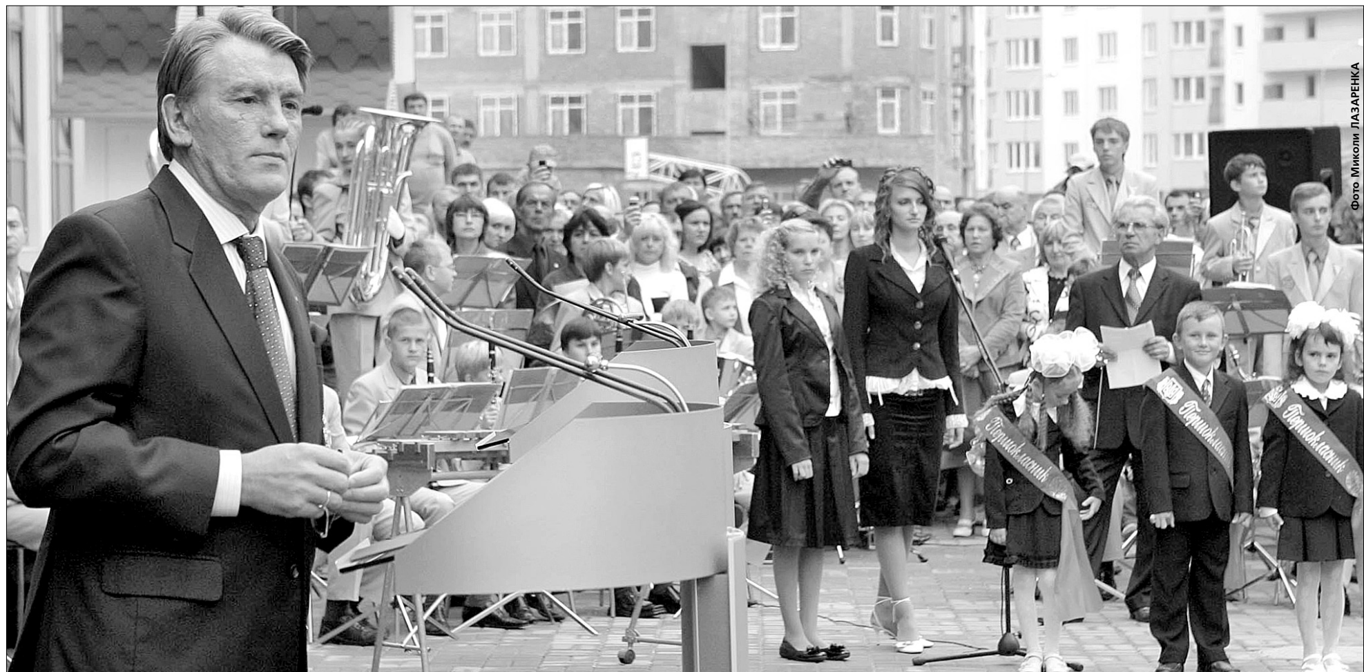
Віктор Ющенко впевнений, що діти, які пішли цього року в перший клас школи № 329, залишать слід в її історії