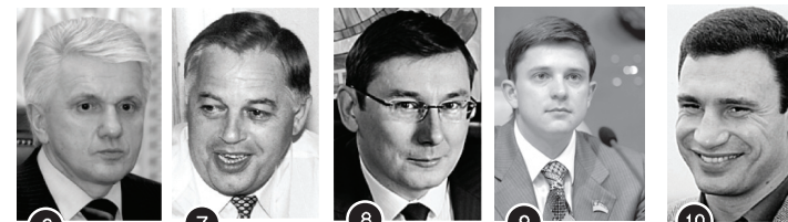
6 Литвин В. 6 % 7 Симоненко П. 4 % 8 Луценко Ю. 4 % 9 Довгий О. 3 % 10 Кличко В. 2 %