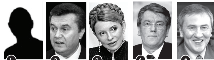
1 Свій варіант 31 % 2 Янукович В. 23 % 3 Тимошенко Ю. 11 % 4 Ющенко В. 8 % 5 Черновецький Л. 7 %

Судячи з результатів опитування, проведеного call-центром Київської державної адміністрації, кияни вважають людиною з найбільшими потребами Віктора Януковича (23 %). Проте більшість респондентів усе ж обрали свій варіант (31 %). Прем'єр-міністру "дихає в потилицю" лідер блоку свого імені Юлія Тимошенко (11 %), а поважне четверте місце за обсягом потреб посідає, на думку опитаних, Президент України Віктор Ющенко (8 %).