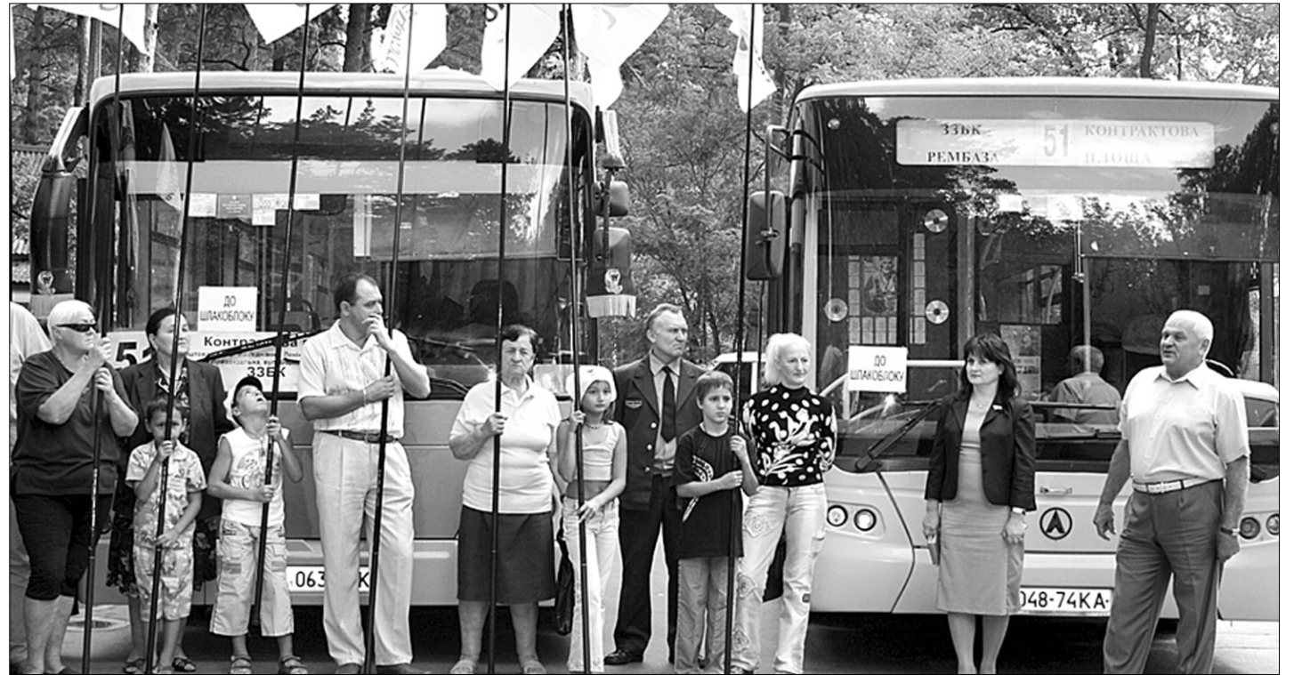
Депутати Блоку Леоніда Черновецького домоглися виділення тринадцяти автобусів для 51-го маршруту в Дарницю

Маршрут, що пролягає через увесь район, продовжили на два кілометри