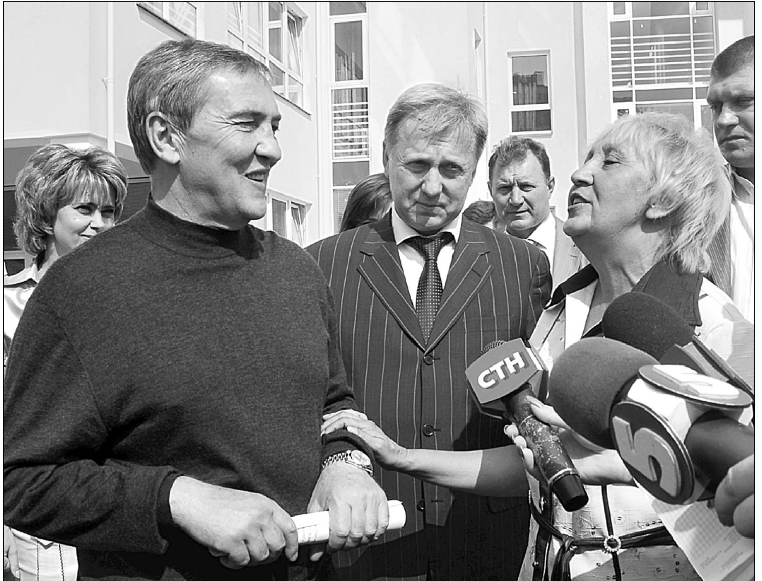
Мешканці району подякували меру за те, що їхні діти навчатимуться в сучасній школі

Леонід Черновецький додав, що ці заклади освіти нового зразка. Окрім 329 школи та садочка "Веселка", в новому