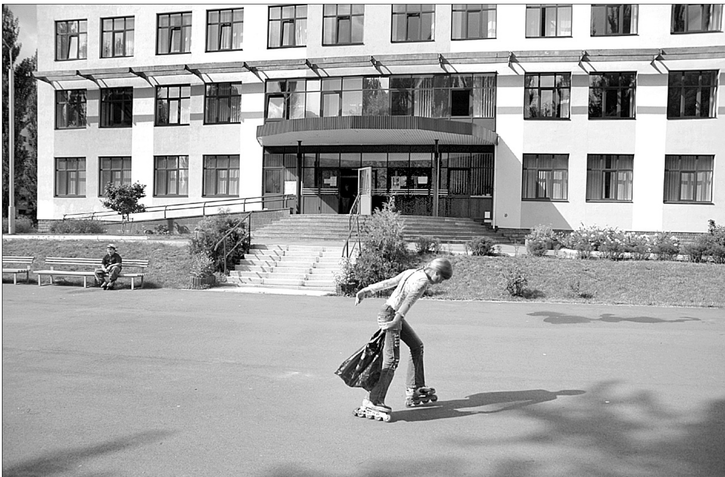
Реконструйована школа № 76 у Святошинському районі готова прийняти школярів

Реконструкція столичних шкіл це не просто ремонт. Школа № 162 в Святошинському районі після реконструкції отримала 3-поверхову прибудову, де будуть нові навчальні приміщення, спортзал, басейн. Якщо раніше в школі навчались 210 учнів, то після реконструкції заклад зможе прийняти 900 дітей. На роботи витратили 26 млн грн. Всього у 2007 році на підготовку до нового навчального року міською владою, за словами заступника голови КМДА Віталія Журавського, виділено 157 млн грн ●