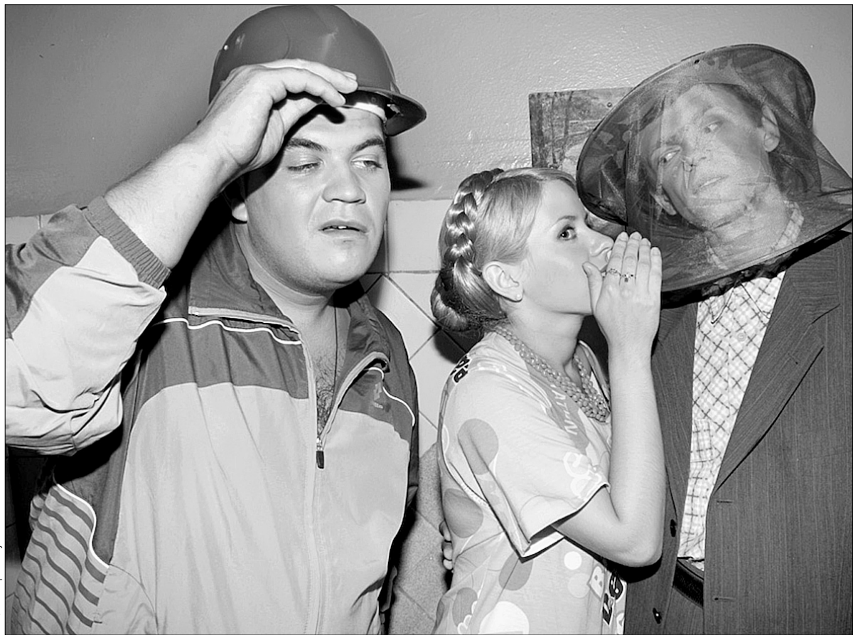
Жінка з косою, чоловік із шахтарським минулим та пасічник безпомилково вказують на відомих політичних діячів

Юлія Володимирівна, Віктор Андрійович та Віктор Федорович стануть героями гумористичного серіалу