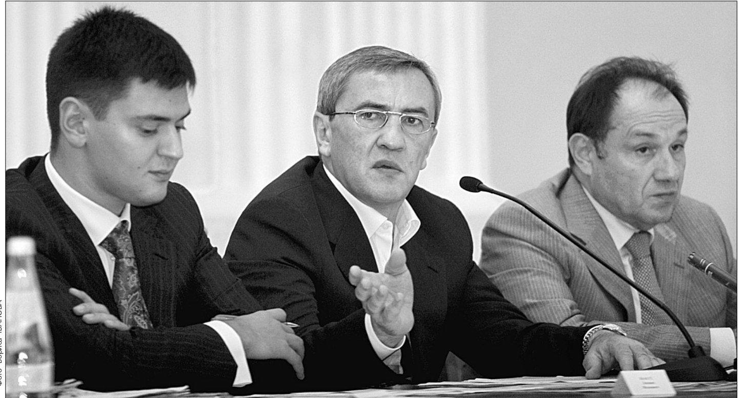
Київський міський голова Леонід Черновецький заявив, що за неналежне виконання своїх обов'язків чиновники будуть покарані

Сто двадцять начальників ЖЕКів оштрафовано за незадовільний стан прибудинкових територій