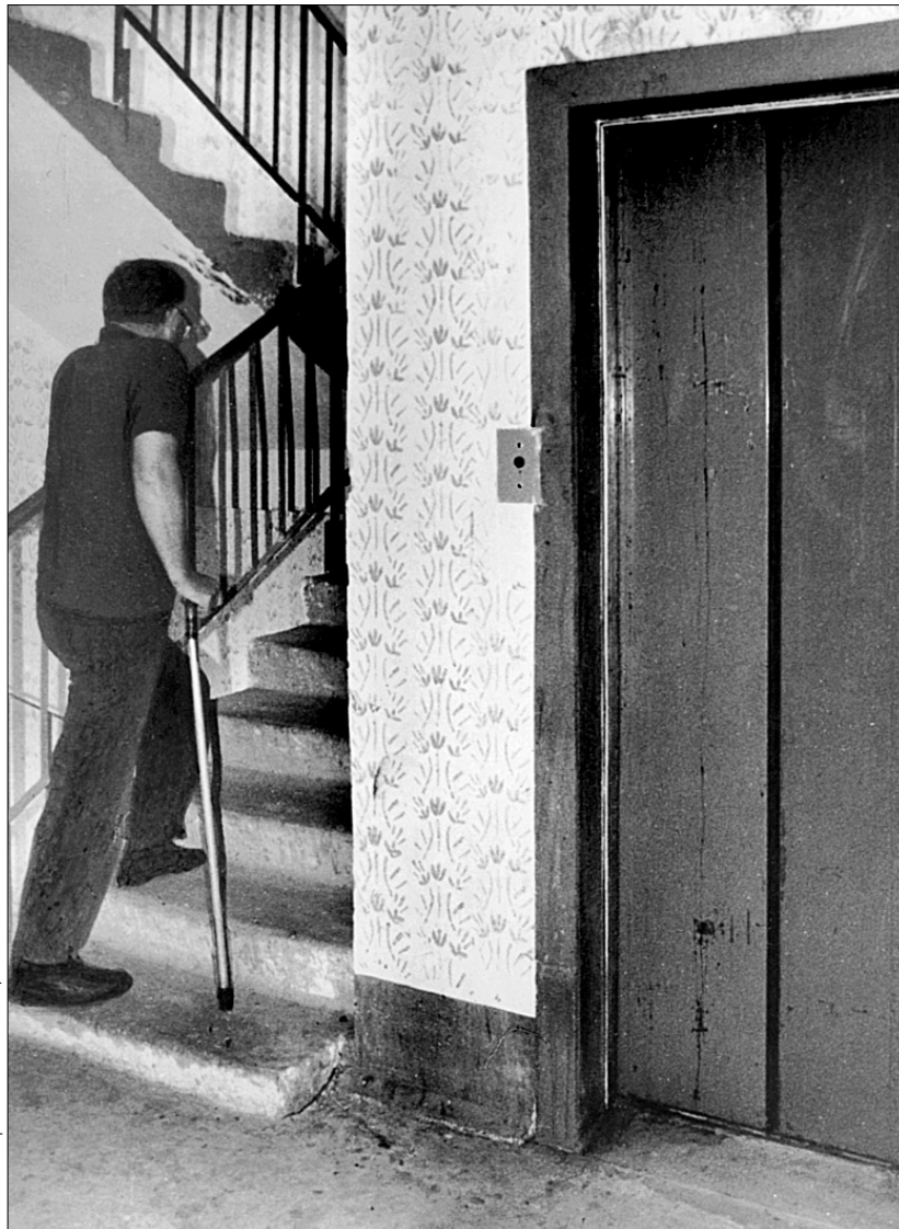
У Святошинському районі на непрацюючі ліфти поступило майже 400 скарг

Серед проблем Святошинського району, за результатами call-центру, лідирує гаряче водопостачання: тільки за місяць надійшло 593 скарги. За ним іде проблема подання