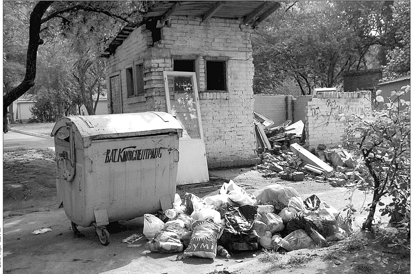
У Святошинському районі сміттєзвалища сусідують з місцями відпочинку

у Святошинському районі сквери та парки обживають бомжі