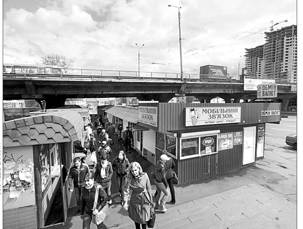
Міська влада наполегливо пропонує торговцям вийти з-під мосту і зайняти будь-які із двох тисяч вільних місць на київських ринках

“Керівництво ринку, що залишився біля станції метро “Шулявська”, посилило протипожежну техніку безпеки. Проте, аби повністю унеможливити ще одну пожежу, ми працюємо з продавцями та керівництвом ринку, постійно пропонуємо