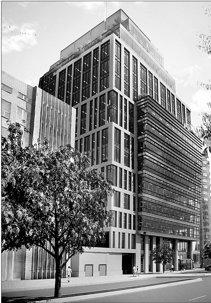
У перші 5 поверхів висотки на вулиці Кутузова, 18/7 переселяться печерські правоохоронці, інші приміщення передбачено під офіси