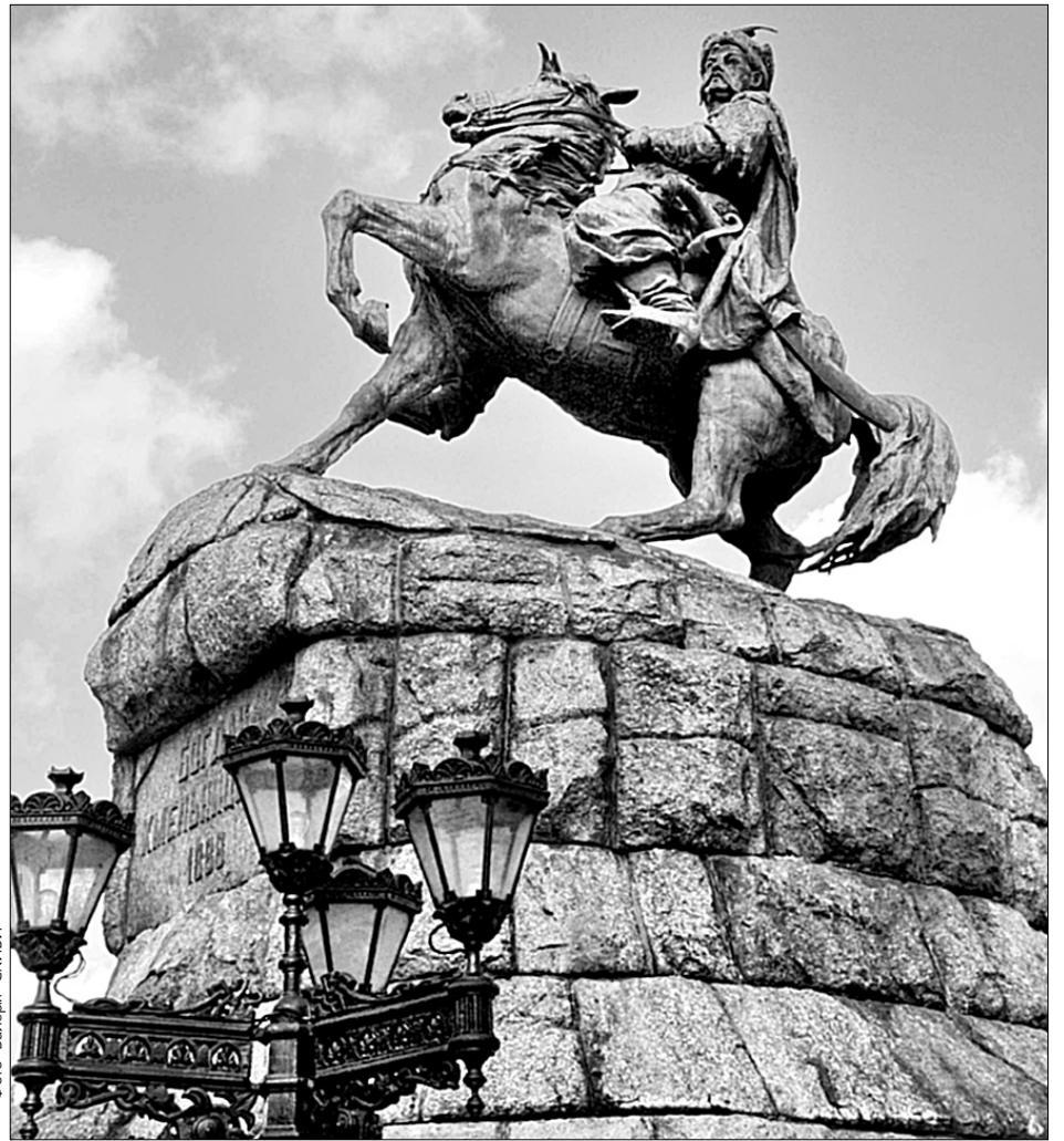
Деякі іноземці ще бачать у Києві місто визначних пам'яток, а не столицю секс-індустрії Східної Європи (див. нижче)