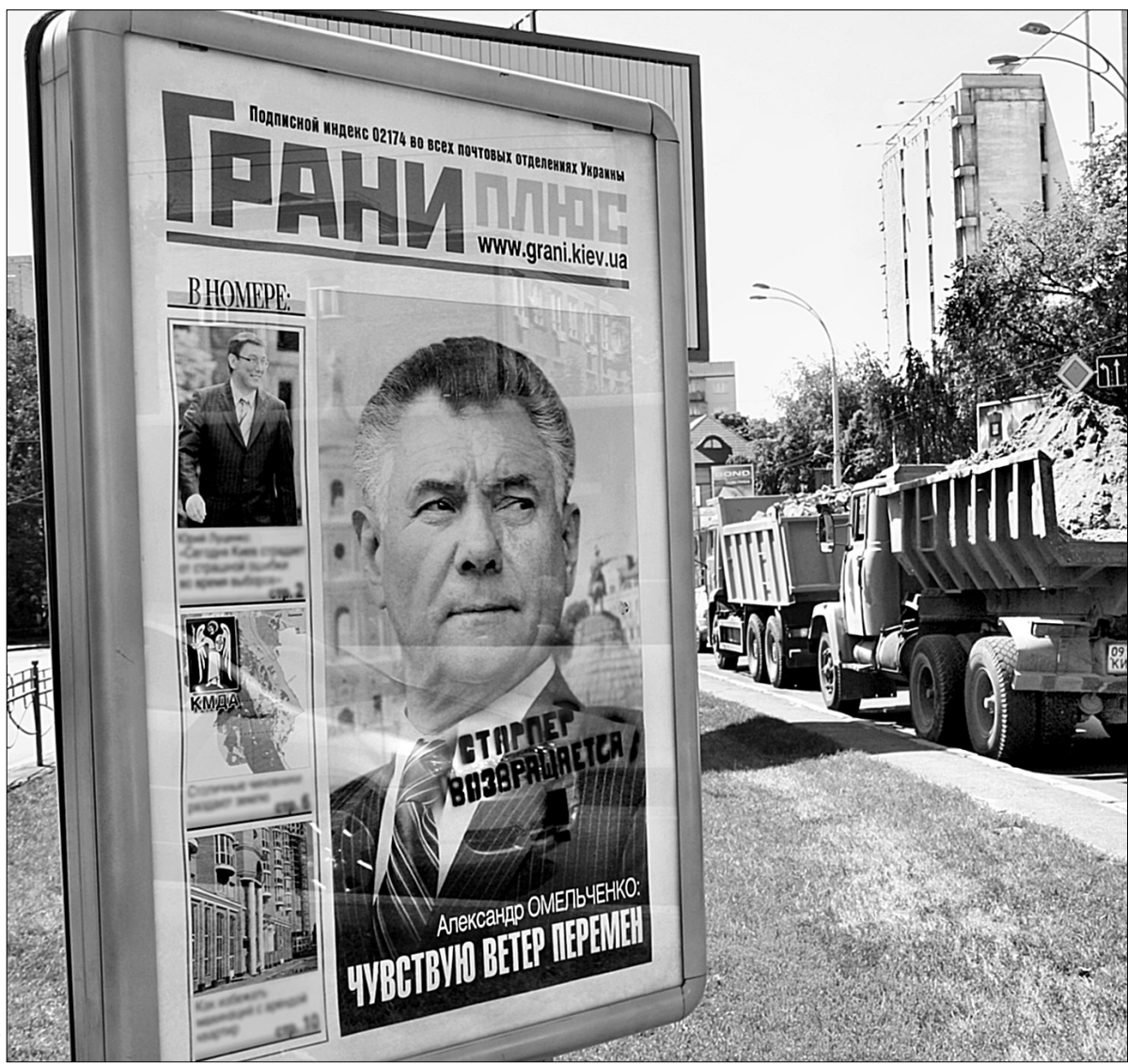
Мешканці Києва з радістю сприйняли повернення Олександра Омельченка на політичну арену

Кияни не пробачили політичному пенсіонеру Олександрові Омельченку його "досягнень"