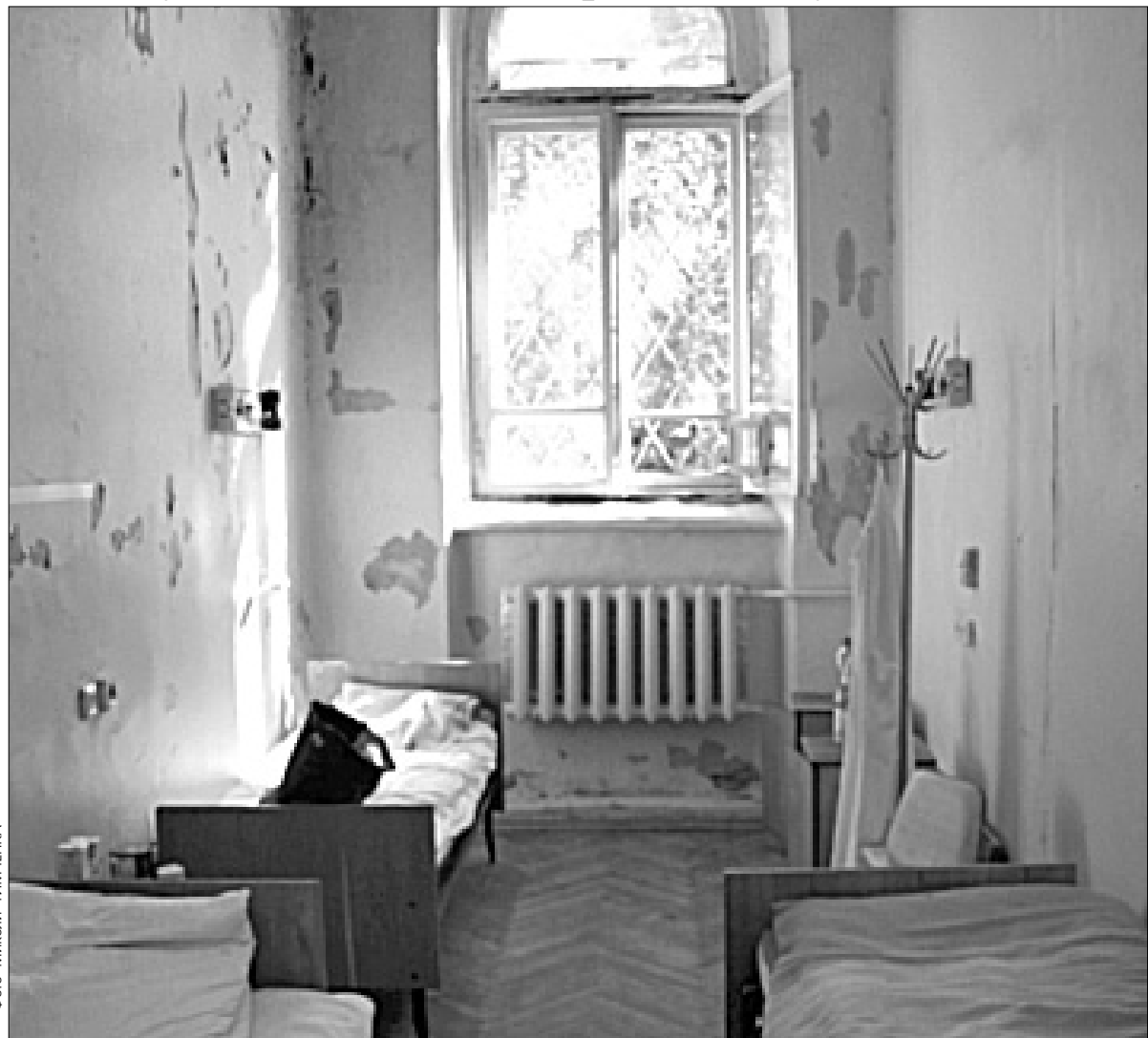
Такий вигляд мають палати Жовтневої лікарні після керування столичною медициною часів Олександра Омельченка Валерія Бідного

Жовтнева лікарня опинилася в руках сімейного клану, який довів до ситуації, коли половину закладу віддано під комерційні забудови