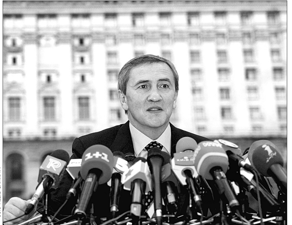
Леонід Черновецький пообіцяв звільнити начальників ЖЕКів, території яких найбільш засмічені

Зважаючи на незначні розміри соціальної допомоги та пенсійних виплат з боку держави, КМДА вперше запровадила щомісячну або шоквартальну систематичну виплату адресної допомоги більш ніж 400 тис. малозабезпечених киян. А за програмою “Турбота” міська влада створила розгалужену інфраструктуру соціального обслуговування громадян похилого віку, інвалідів та самотніх. Останніх у Києві майже 43 тис.