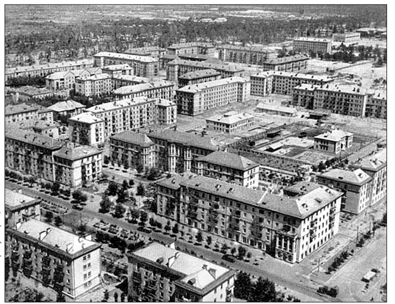
Заселення району активізувалося в середині минулого століття після будівництва мосту Патона

Селище Позняки відоме з 1571 року як місце поселення бояр, підпорядкованих київському воеводі (очевидно, й назву дістало від одного з бояр). З 1635-го населений пункт перебував у власності Києво-Братського монастиря. В 20-х роках XX століття Позняки ввійшли до складу міста, і в 1980-х роках там почали зводити житловий масив.