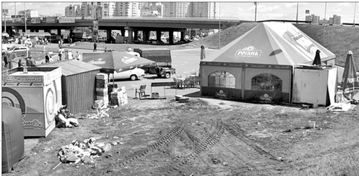
Незаконні торгові намети та МАФи з'являються на Позняках, як гриби після дощу

"Здавалося б, восторжествувала демократія. Проте це тривало лише кілька місяців. Очевидно, беззаконня в Дарниці сильніше від порядку. Після того, як міська комісія поїхала з району, а місцева влада удала, що бореться з беззаконням, все повторилося знову. Як гриби, ростуть незаконно встановлені МАФи, знищуючи зелену зону і клумби (фото додаємо), а в переходах людям, що поспішають на роботу, пройти стає все важче і важче", — цитата з листа жителів Дарницького району. ●