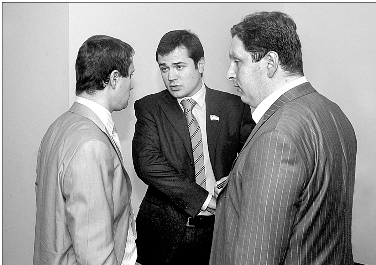
Депутатів Київради обурили корупціонери з Дніпровської райадміністрації