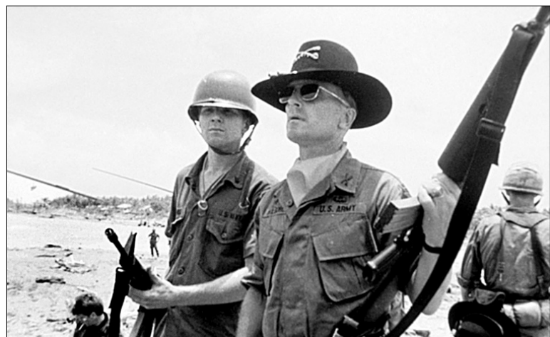
Герої "Апокаліпсису" приїхали до В'єтнаму відкривати темні сторони людського "я"

На парадоксі побудовано і "Час прощання" (2005) Франсуа Озона (1 серпня, Київ, 21.30). Найвідоміший французький режисер останніх років завжди використовував мертве тіло як каталізатор сюжету, сповненого гомосексуальної пристрасності. Цього разу мертве тіло саме провокує розвиток сюжету. Головний герой у виконанні блискучого Мельвіля Пупо раптом втрачає спокій, дізнавшись, що він невиліковно хворий і через кілька місяців має померти. Герой вирішує навідатися до друзів і попроситися з ними. Цікаво, що це практично перша стрічка Франсуа Озона, у якій можна відчитати бодай якусь мораль. Режисер стверджує: лише усвідомивши свою смертність, можна поцінувати життя ●