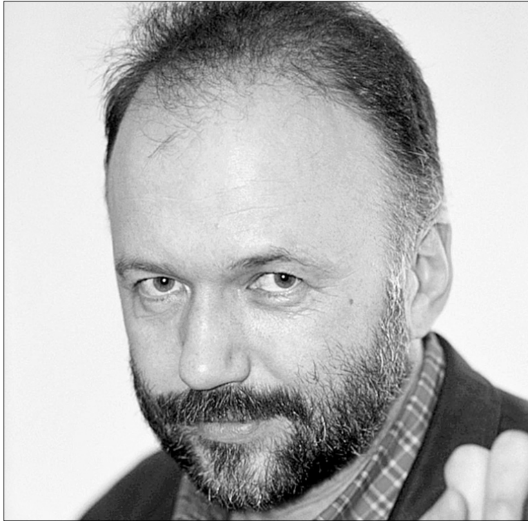
Андрій КУРКОВ спеціально для "Хрещатика"

Найдзвінкіший звук з мого дитинства, що зберігся в пам'яті, це літній дзвін лісового трамвая. Трамвай № 12 їздив колись від вокзалу через Куренівку в Пущу-Водицю. Він ще дзвенить регулярно Пушчанським лісом, хоча його маршрут давно став коротший. Але тепер він не такий чудовий. А тоді, на початку шістдесятих, коли я вчився читати і писати, сидючи в альтанці на подвір'ї бабусиного будинку, цей трамвай здавався єдиним зв'язком з "великою землею", з Києвом, куди ми майже не виїжджали. Зате Київ та всі інші міста з'їжджалися до Пущі-Водиці й розсмоктувалися по санаторіях і піонерських таборах. Тисячі відпочивальників купалися в озерах, шикувалися в чергу перед касами в кінотеатр "Барвінок", йшли по товари в місцевий універмаг на тринадцятій або чотирнадцятій лінії, а найбагатші вирушали в ресторан "Хвиля" на дев'ятій лінії неподалік від греблі.