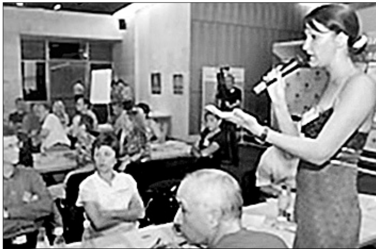
Актуальне питання здорового способу життя в Україні залишилося відкритим

Передусім людина сама повинна відповідати за власне здоров'я, а лише потім до цього можуть бути причетні сім'я, держава і, безперечно ж, засоби масової інформації. А допоможуть сучасній людині стати такою: якісні продукти споживання і медицина, створення державою належних умов для відпочинку і оздоровлення, виховання змалечку культури здорової поведінки та відповід-