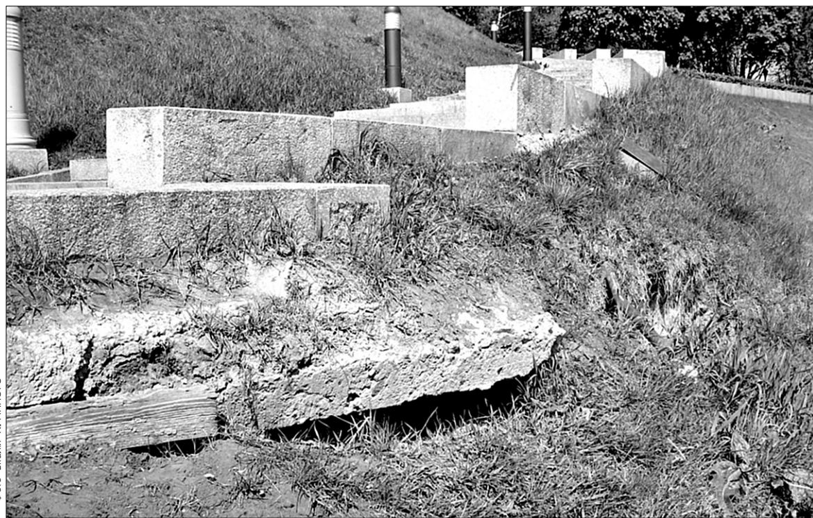
Фахівці вважають парк Вічної слави одним з найбільш зсувонебезпечних об’єктів у столиці