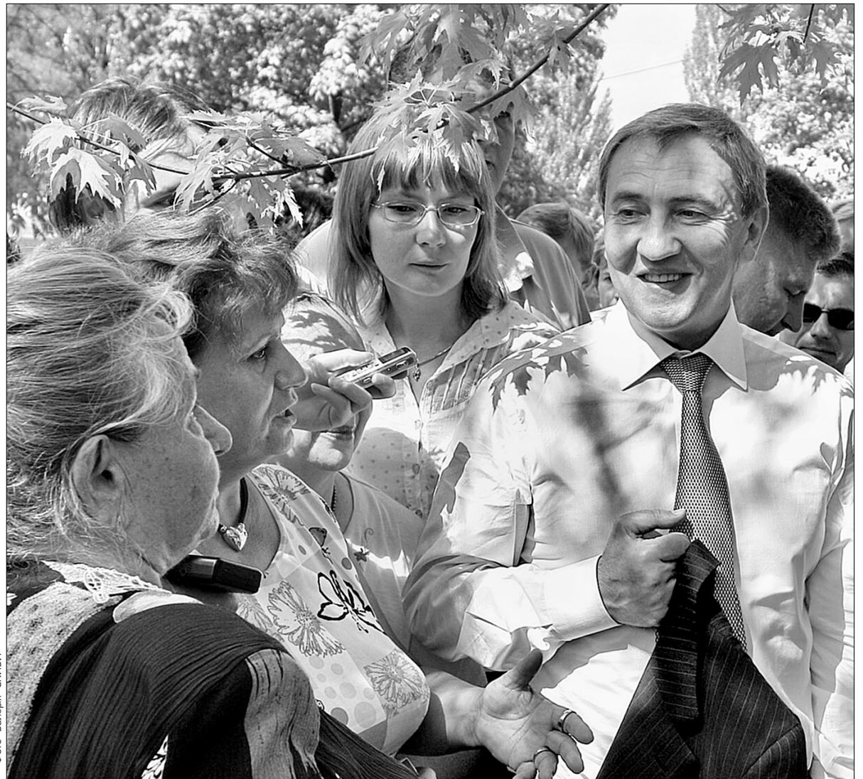
Леонід Черновецький оцінив рішучість мешканців протистояти бандитам

Мер подякував мешканцям вулиці Березняківської за те, що вони не злякалися бандитів і відстояли свої права