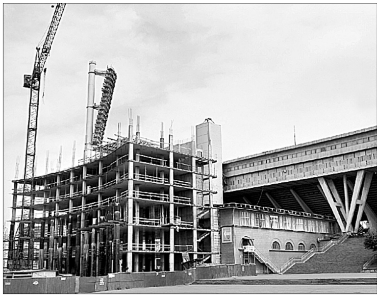
Доля торговельного комплексу залежатиме від результату політичного протистояння