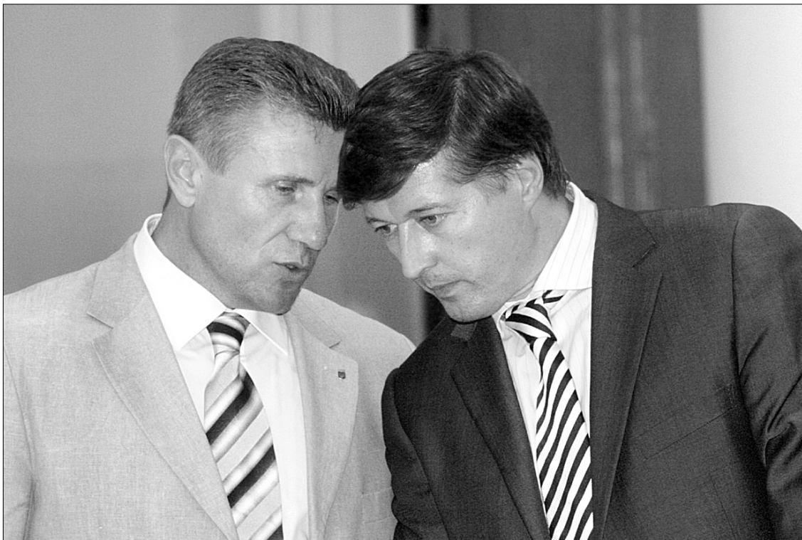
Сергій Бубка та Віктор Корж доклали багато зусиль для проведення Європейських ігор в Україні

Закінчення. Початок на 1-й стор. До Організаційного комітету з підготовки та проведення I Європейських спортивних ігор увійшли Київський міський голова Леонід Черновецький, заступник голови КМДА Віталій Журавський, міністр у справах сім'ї, молоді та спорту Віктор Корж, міністр охорони здоров'я Юрій Гайдаєв, перший заступник міністра фінансів Вадим Копилов та віце-прем'єр Дмитро Табачник.