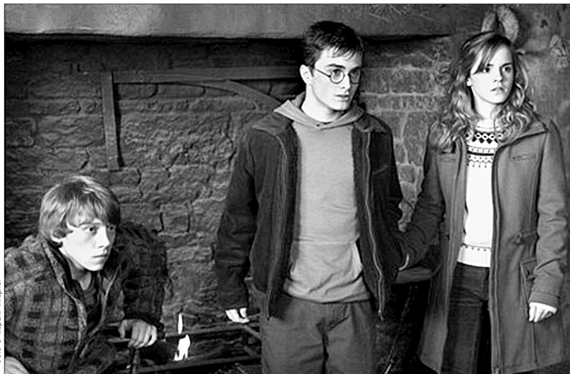
Деніел Радкліфф (у центрі) вже п'яту картину поспіль зображує на обличчі тривожне напруження

Виконавець головної ролі, наприклад, усвідомивши, що не завжди ж йому ходити в круглих окулярах та із зигзагом на лобі, вдавняв навіть до деякої активності: став наймолодшим експонатом Музею мадам Тюссо. А ще —