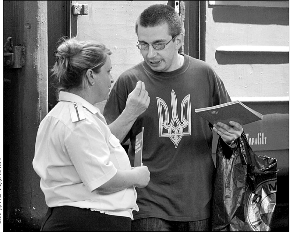
Волонтер руху пояснює провідниці, як поміняти “часы” на годинник

Учорашня подія — третій крок акції “Не будь байдужим!” (перший організатори зробили торік у грудні, другий — у квітні-червні цього року). Небайдужі до української мови рок-гурти “Мандри”, “Гайдамаки”, “Мотор’ролла”, “От Vinta!”, “Широко закриті очі”, “ФлайзZza” підтримали захід і роз’їжджають по країні з “мовними” концертами. Одна умова, якої мають дотримувати волонтери, — не навізуватися людям.