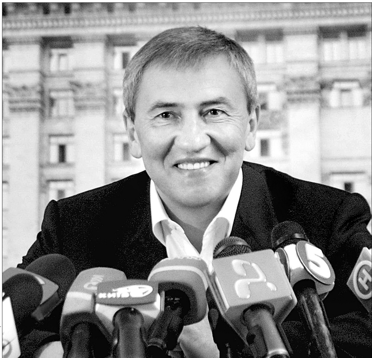
Міський голова не заперечує можливості взяти участь у парламентських виборах 30 вересня

Леонід Черновецький припускає можливість участі свого блоку в парламентських виборах