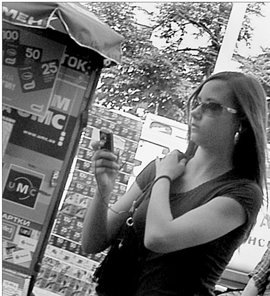
Користувачі спокуюються на дешеві “прямі” номери й переходять зі стандарту GSM (на фото) на CDMA

За даними тієї ж компанії, в другому кварталі 2007-го скоротилася кількість користувачів мобільного зв’язку оператора Голден Телеком. За минулий рік компанія збільшила кількість абонентів на 7,4%, тобто до 51 тис. З цим показником вони закріпилися на 5-му місці серед надавачів послуги. А втім, у другому кварталі 2007-го він зменшився на 3,9%, або до 49 тис. абонентів. Директор компанії Голден Телеком зі зв’язків