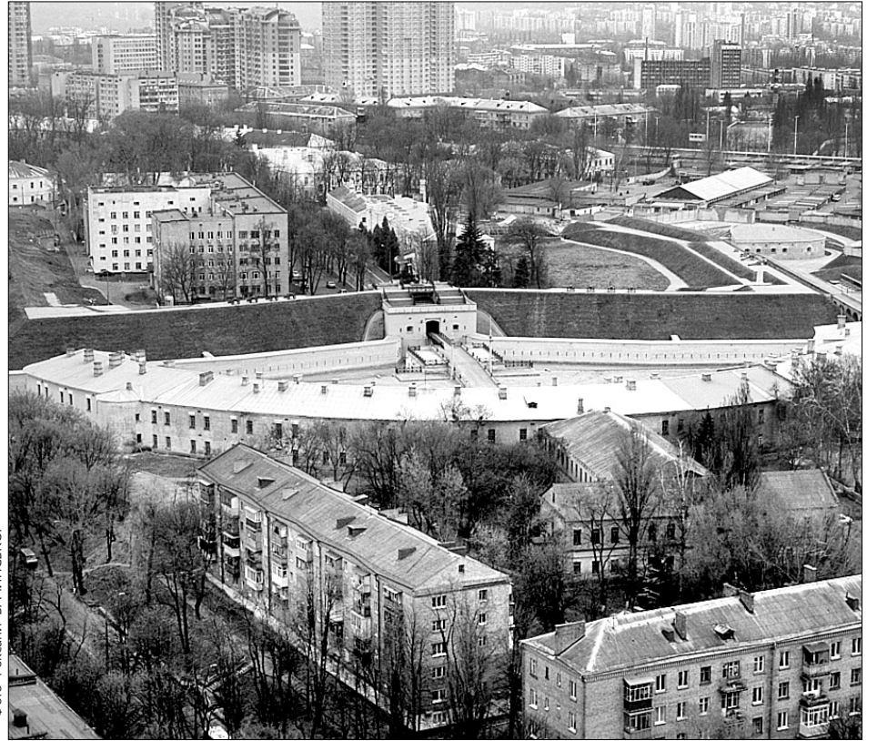
Київською фортецею іноземних туристів хочуть зацікавити так само, як і матчами "Євро-2012"