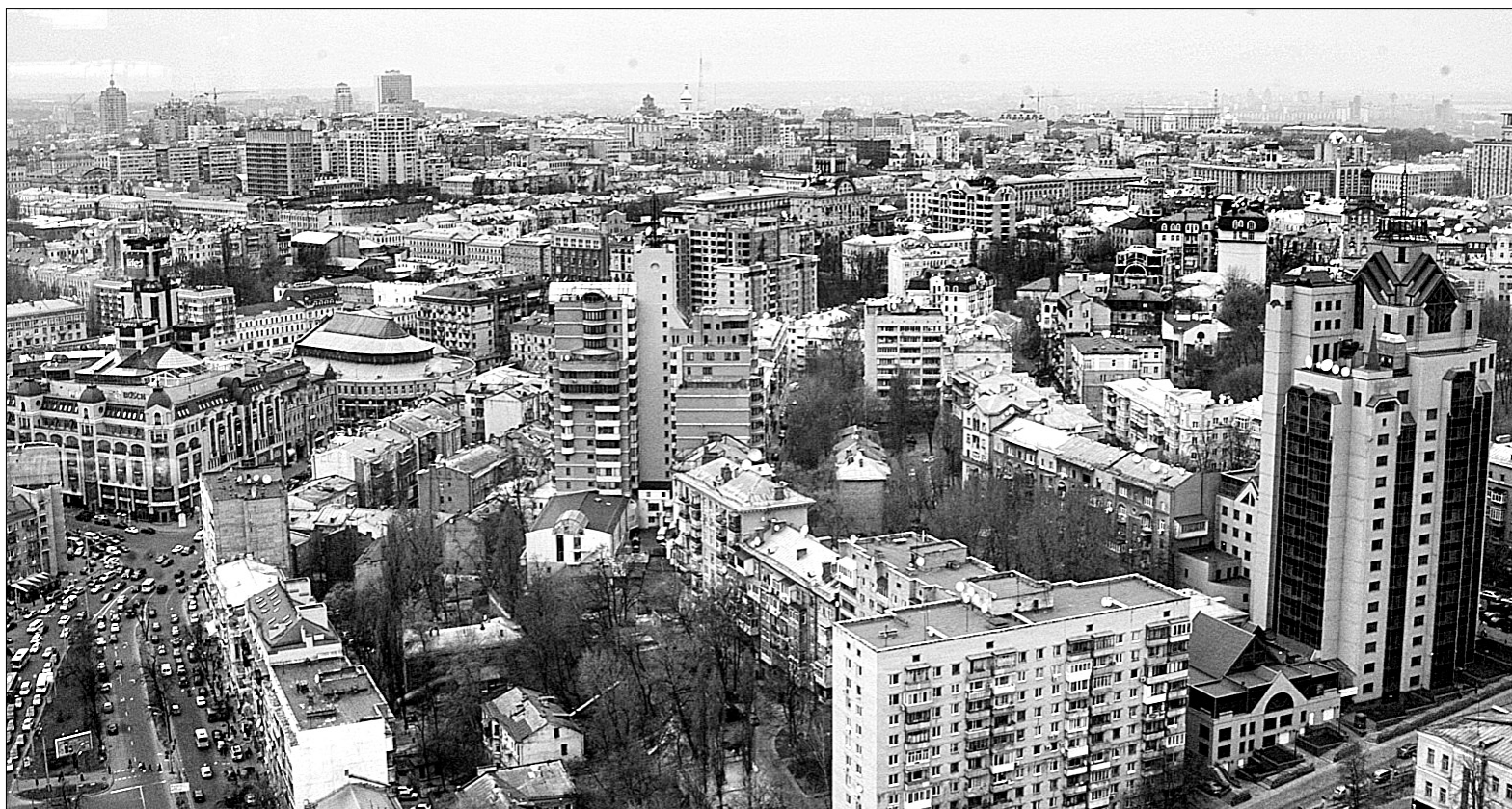
На думку російських журналістів, за останні 10—15 років Київ змінився до невпізнання

1 кг хліба — 2 грн 1 л молока — 2,5—3,5 грн 1 кг сиру — 8—10 грн 1 кг сиру твердого — 15—30 грн 1 кг яловичини — 20—30 грн 1 кг свинини — 20—35 грн 1 кг яблук — 4—6 грн 1 кг помідорів — 5—8 грн Квиток у кіно — від 10 до 50 грн Квиток на футбол — від 5 до 60 грн ●