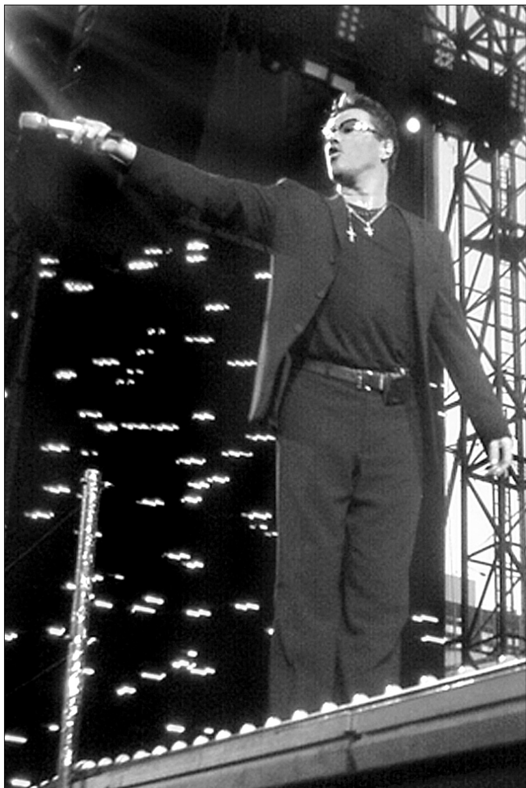
Джордж Майкл дав змогу киянам заспівати разом з ним

І з його допомогою співак дав єдиний концерт в “Олімпійському”