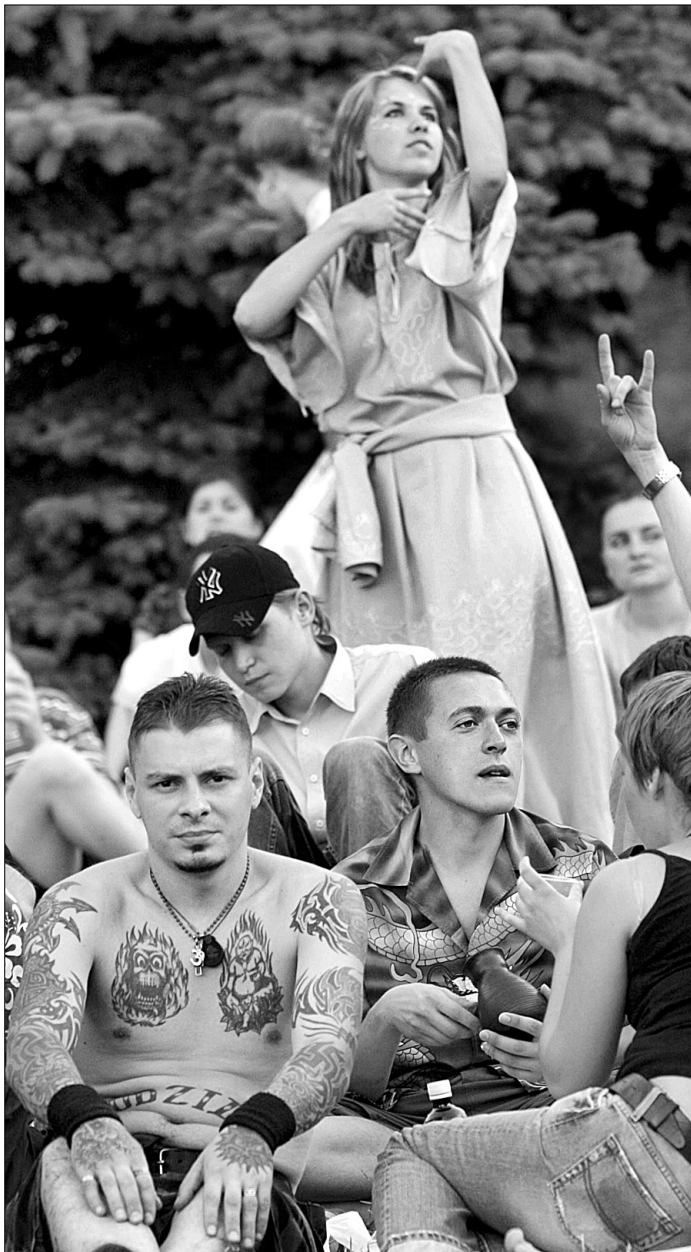
Фестиваль "Країна мрій" довів скептикам, що громадянське суспільство в Україні є