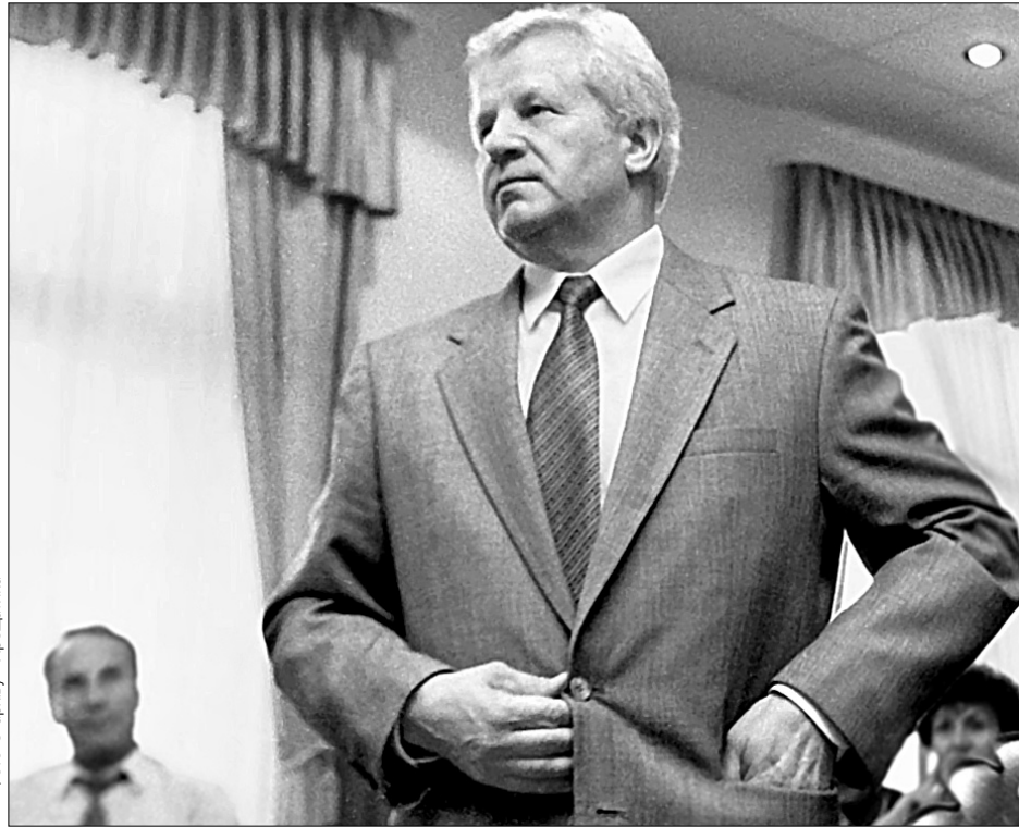
У міжсесійний період спікер шукатиме спонсорів для поповнення партійної кишені

Фракція Партії регіонів голосувати за поправки до Конституції не буде. До слова, вчора на своїй прес-конференції міністр юстиції Олександр Лавринович навівав слова прем'єр-міністра Віктора Януковича про те, що для внесення будь-яких змін до Конституції України у парламенті треба створити спеціальну комісію. Поки що такої комісії немає.