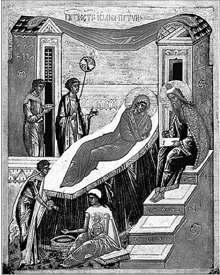
Різдво Чесного Славного пророка, Предтечі і Хрестителя Господнього Іоанна

Седмиця 6-та після П'ятдесятниці. Апостола Іуди, брата Господнього (близько 80). Святителя Іова, патріарха Московського і всієї Русі (1607). Преподобного Варлаама Важського, Шенкурського (1462). Мученика Зосими (близько 89—117). Преподобного Паїсія Великого (V). Преподобного Паїсія Хілендарського, Болгарського (XIII).