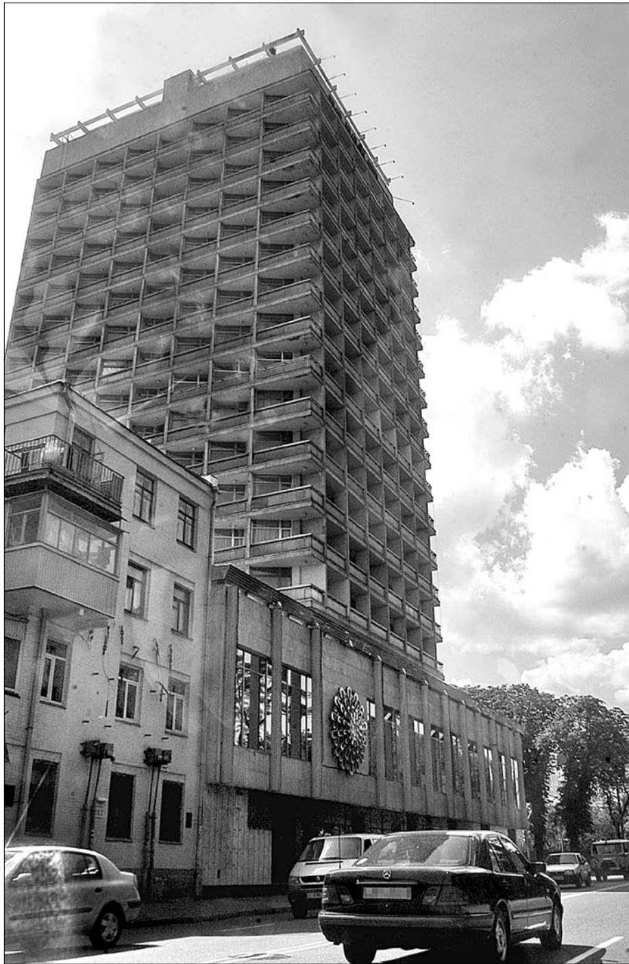
У готелі "Київ" депутати ВР проживають у одномісних номерах з усіма зручностями

Цікаво, але ще рік тому кількість парламентаріїв, які тимчасово проживали у цих готелях, становила 146 чоловік. 40 чоловік змінили готельні номери на більш привабливі помешкання. До того ж деякі депутати лише формально зареєстровані в "Україні" і "Києві", на-