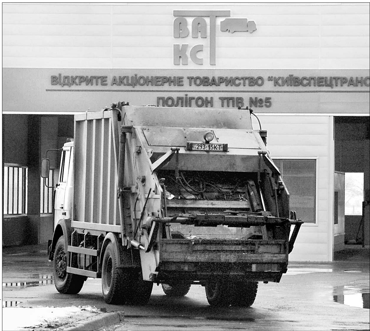
ЗАТ "Київспецтранс" доведеться на рівних умовах змагатися за право вивозити сміття

Фірми — перевізники сміття через занижені розцінки за кілька місяців зазнали збитків на 14,5 млн грн