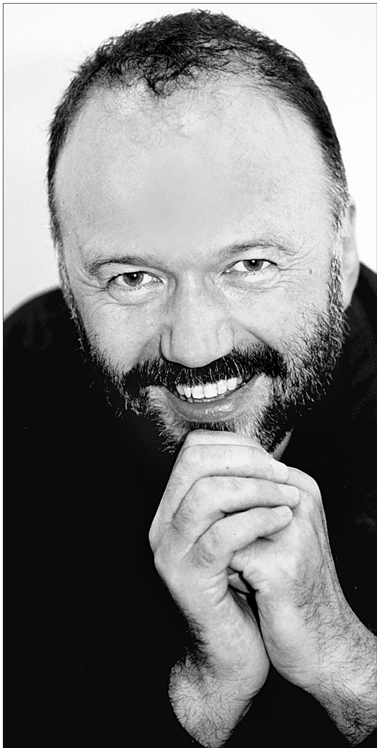
Андрій КУРКОВ письменник