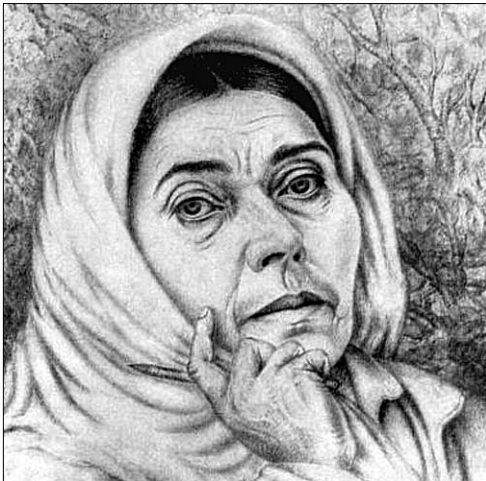
Автопортрет Катерини Білокур

Побачила світ нова книга листів художниці з народу