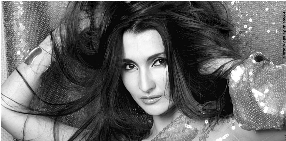
Фото з архіву співачки