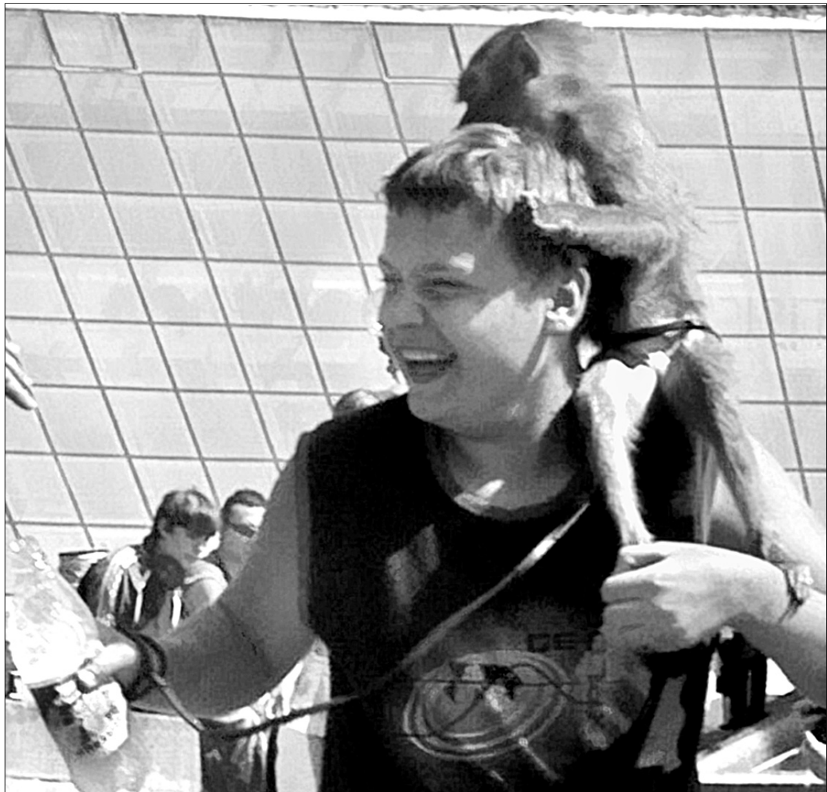
Під палючим сонцем мавпочка не розділяє радості свого хазяїна

Гнобителів звірів штрафуватимуть від 200 до 2500 гривень, а їх самих забиратимуть до тимчасового розподільника