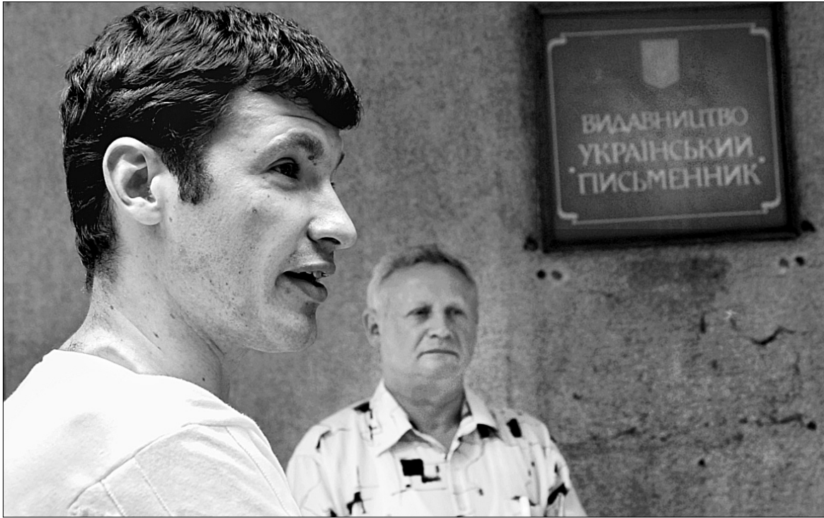
Адвокат звільненого директора "Українського письменника" переконує у тому, що народний депутат Володимир Яворівський підробив рішення президії Національної Спілки письменників України

Група письменників України намагається ліквідувати видавництво "Український письменник"