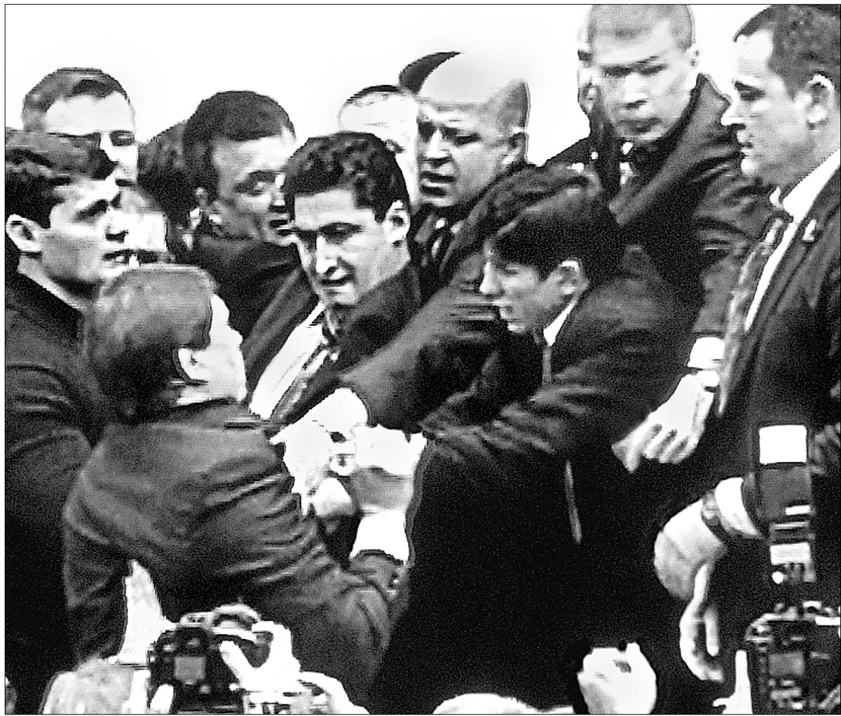
Дехто скучив за таким варіантом проведення сесій Київради

Завтра нардепи-бютівці намагатимуться зірвати сесію Київради, недопустивши частину депутатів до сесійної зали