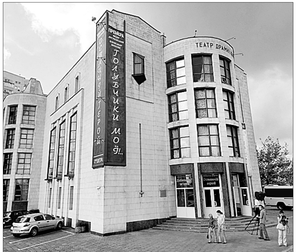
Театр драми і комедії готується до комплексної реконструкції