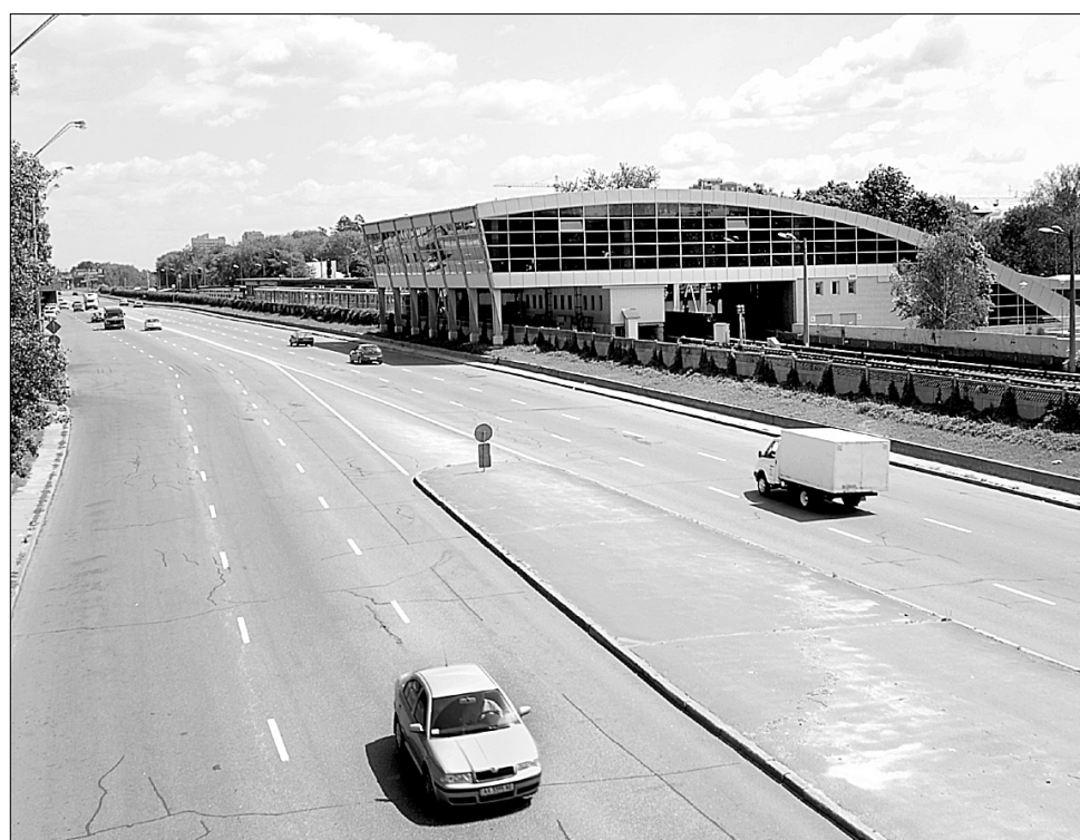
Неподалік від другого виходу із станції метро “Дарниця” створять сучасний транспортний вузол