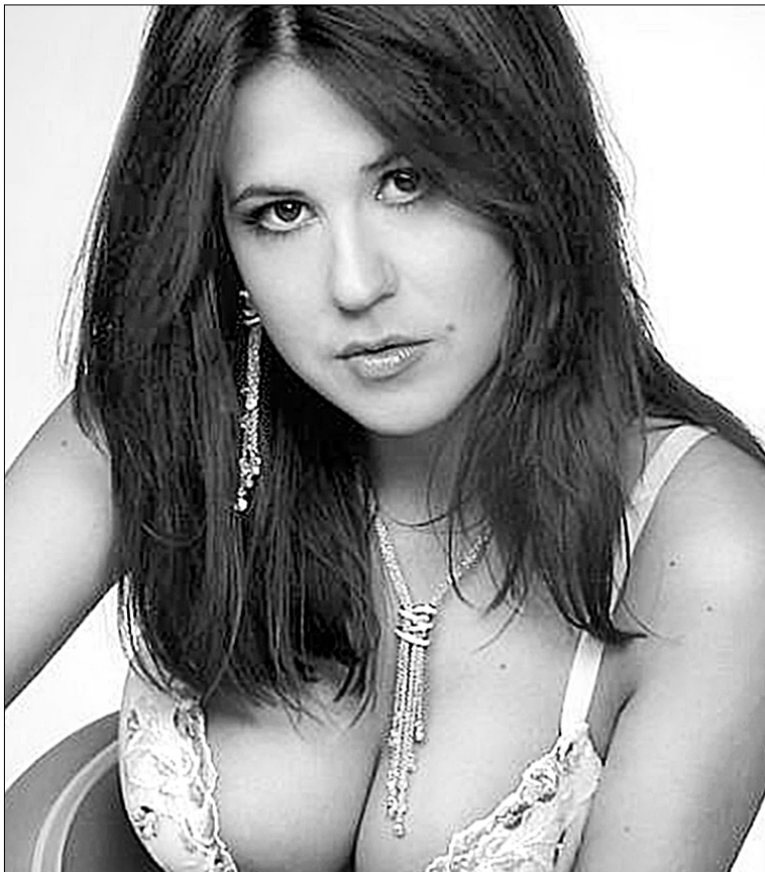
Анжеліка РУДНИЦЬКА, співачка