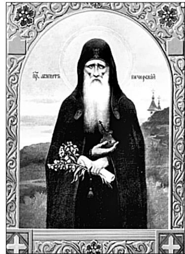
Преподобний Агапіт Печерський

У той час жив у Києві дуже досвідчений лікар-вірменин, котрий міг передбачити день смерті хворого. Якось він сказав, що бояринів князя Всеволода залишилися жити вісім днів. Недужого принесли в монастир і за молитви Агапіта зарадили лиху. Так преподобний набув слави "лічця", чим і накликав на себе задрощі іновірця, який намовив своїх прихильників отруїти Агапіта. Та блаженний, випивши трунок, залишився здоро-