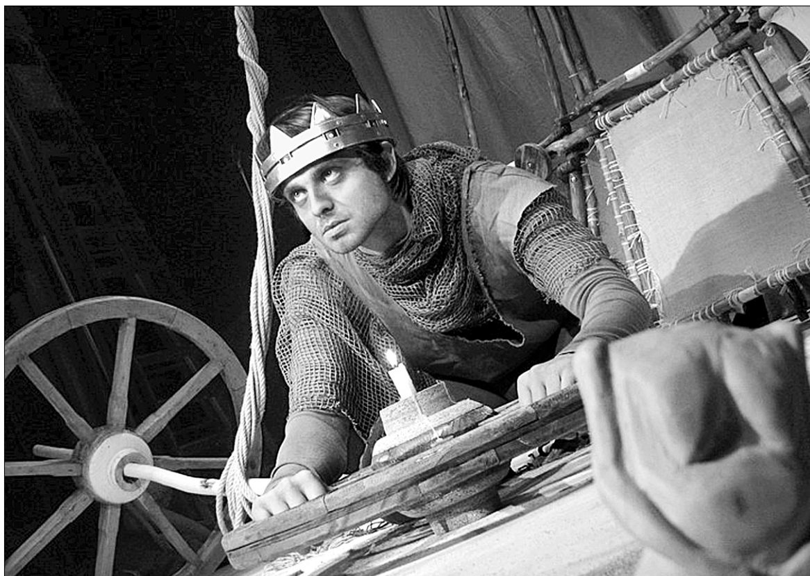
Честолюбного вбивцю Макбета неможливо виправдати, проте його можна спробувати зрозуміти

Київський театр маріонеток засновано 1989 року. Вистави театру неодноразово було нагороджено дипломами міжнародних фестивалів в Україні, Білорусі, Росії, Польщі, Німеччині, Франції, Іспанії, Голландії, Великобританії, Мексиці. Вистави "Хто розбудить сонце" та "Вишневий сад" відзначено театральною премією "Київська пектораль".