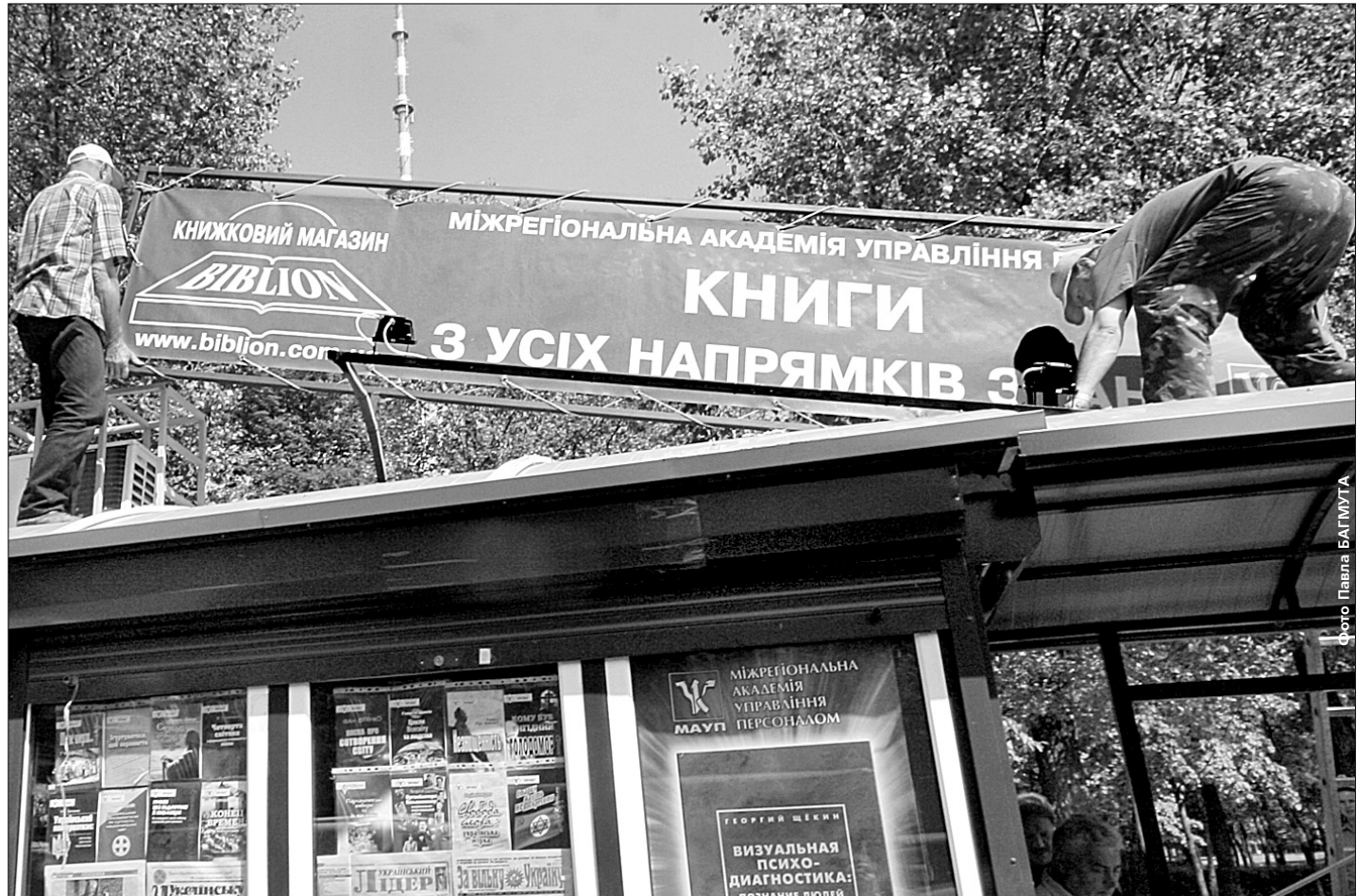
У МАУПівських кіосках продаються книги переважно антисемітського напрямку

Леонід Черновецький пропонує заборонити МАУП займатися освітою