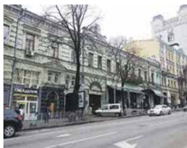
Будинок Бернера Бул. Тараса Шевченка, 1-а

У столиці кілька будівель претендують на внесення до Переліку об'єктів культурної спадщини м. Києва. Всі три будівлі розташовані у центрі міста, в Шевченківському районі. Про це нашому виданню повідомили у Департаменті охорони культурної спадщини КМДА.