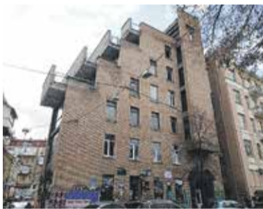
Будинок поліклініки Спілки Письменників Вул. Рейтерська, 15