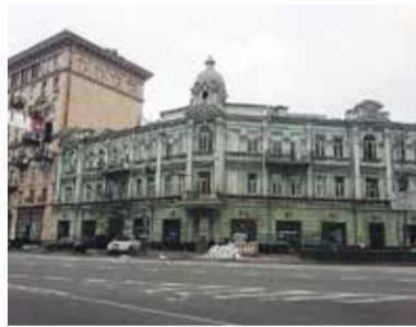
Садиба Фалера Вул. Велика Васильківська, 10

Цей будинок на бульварі, який у ті роки називався Бібіковським, був зведений у 1886 році. Його творець – відомий київський архітектор Володимир Ніколаєв. Споруда є двоповерховою з вулиці і триповерховою з двору. Над його карнизом досьогодні можна бачити ініціали власника «ЯБ» і дату побудови «1886».