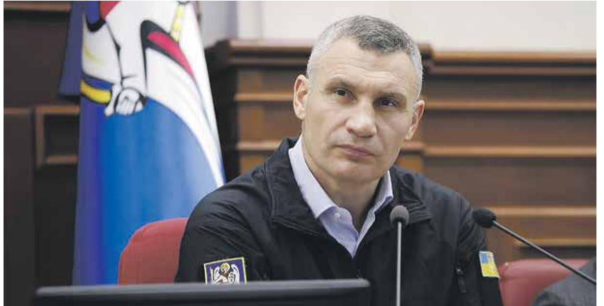
Мер Києва Віталій Кличко на засіданні Київської ради 26 жовтня.

Але ми вирішуємо це, бо ключове питання — допомога військовим. Бажання кожного з українців, щоб якомога швидше мир повернувся на нашу землю, а наші військові боронять нас, нашу країну.