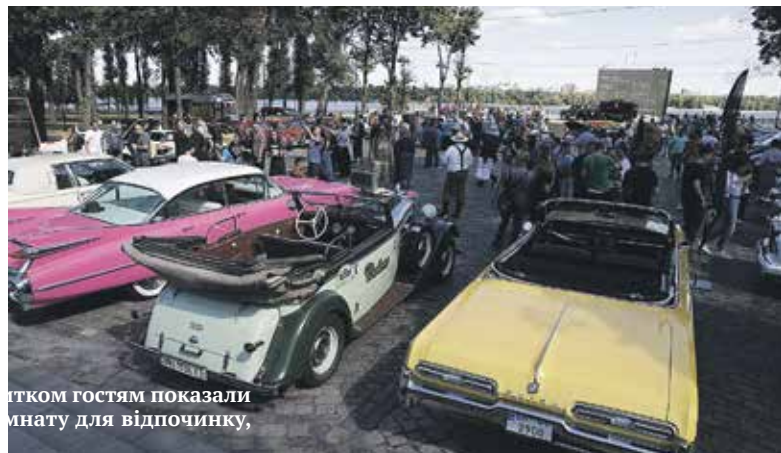
Гостям показали кімнату для відпочинку,

«То був час досліджень і підготовки до польотів у космос, що позначилося на дизайні автівок: їх форми витягувались. У Києві таких кадиллаків кілька, але в такому стані тільки один, — поділився Андрій Ахтирський. — У моєму дитинстві в мене не було навіть мопеда, тому я дуже заздрих іншим хлопцям. Зараз, коли я вже 10 років колекціую, приємно усвідомлювати що захват від автівок передався і дітям. Є на кого