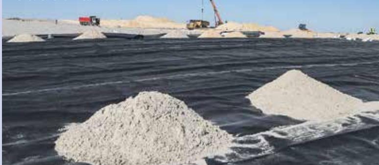
У селі Підгірці на Обухівщині виконують безпечне закриття полігону відходів.

туації. Також слід зважати на неможливість поставити на паузу окремі технологічні процеси та ризик знівелювати вже виконані до цього технічні заходи. Тому місце спільно з оператором полігону продовжують виконувати необхідні роботи з перспективою рекультивуації — безпечного закриття полігону