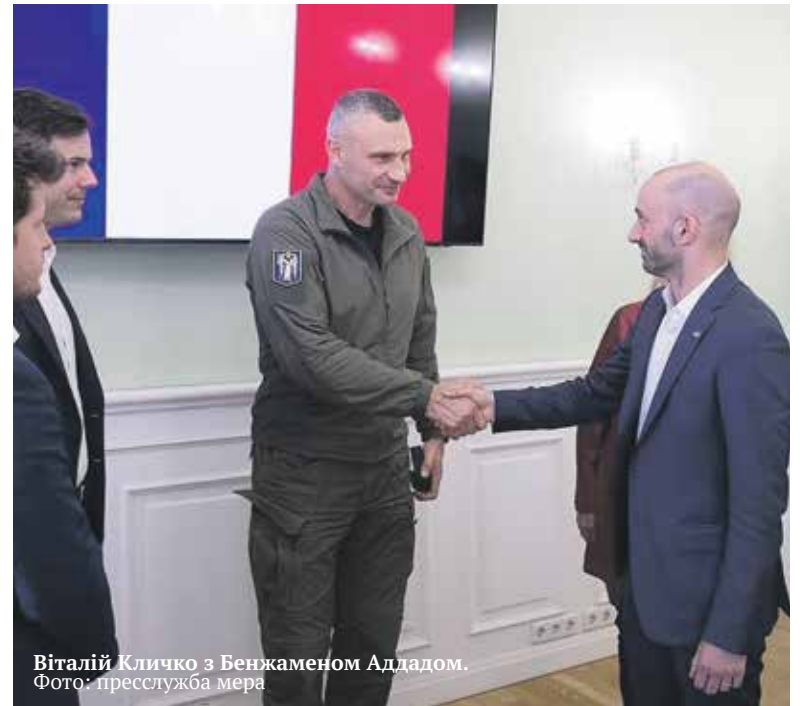
Віталій Кличко з Бенжаменом Аддадом.