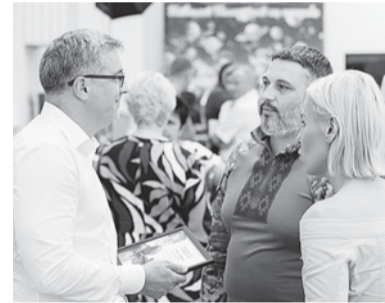
Валентин Мондриївський на зустрічі з освітянами

Педагогічні ради мають обрати форми та формати організації навчального процесу, затвердити алгоритми роботи закладів освіти.