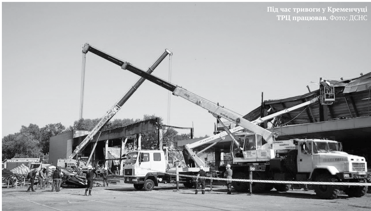
Під час тривоги у Кременчуці ТРЦ працював.