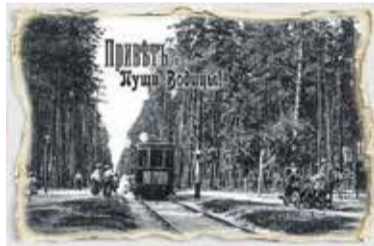
Річку Котурку загатили та перетворили на озеро, а до Києва ходив трамвай.

слоемъ липкойъ грязи, родныя дети въ ужасѣ отшатнутся отъ васъ, а верный Трезоръ или Казбекъ залететь отчаяннымъ лаемъ».