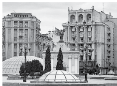
Підписатися на сторінку Управління.

Найкращі фотографії будуть представлені на виставці «Київ незламний» в Центрі комунікації.