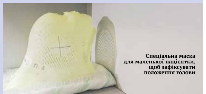
Спеціальна маска для маленької пацієнтки, щоб зафіксувати положення голови

«Можна поставити найсучасніше обладнання, яке допоможе лікувати різні захворювання, але ми сьогодні