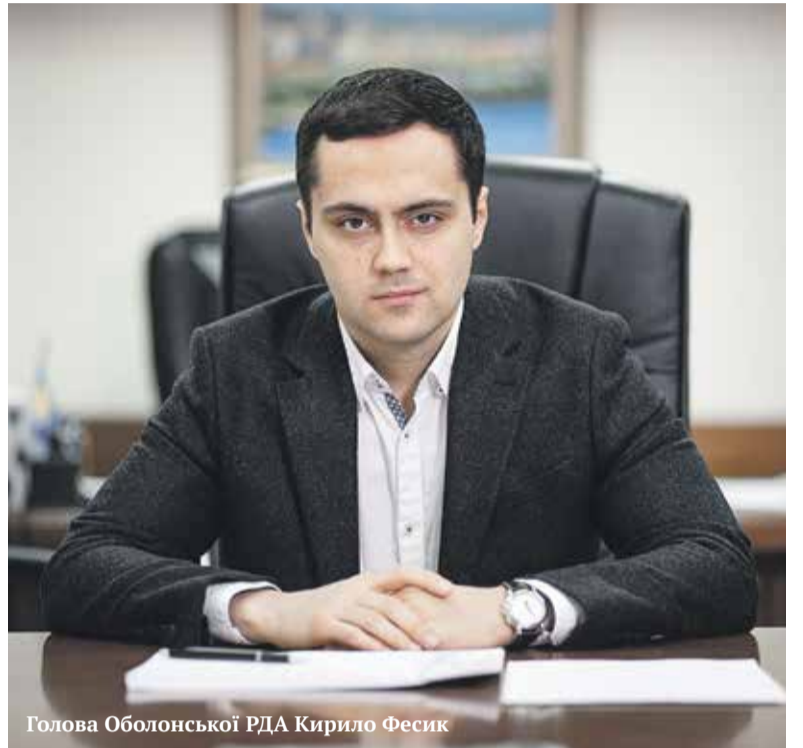
Голова Оболонської РДА Кирило Фесик