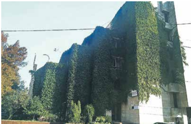
Фасад будівлі до початку демонтажу.

Департамент охорони культурної спадщини вніс будівлю «Квіти України» до Переліку об'єктів культурної спадщини Києва. Копія цього наказу